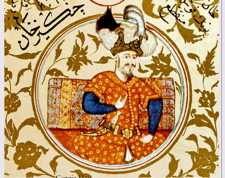
Cengiz Han, Kaynak: İslam Ansiklopedisi

Günümüze kadar ulaşan maddeler içerisinde, ceza, vergi muafiyeti, miras vb. ile ilgili hükümler yer alır; devlet yönetim anlayışına dair kurallar ise günümüze kadar ulaşan maddeler içinde değildir.