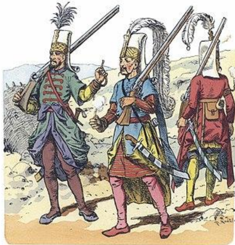
Janitscharen. 16. u. 17. Jahrhundert.

Die Darstellung liegt im gleichen Quellenwerke an Orade, die wir bei den vorhergehenden Abbildungen der Händel und der Hauptkämpfe gesehen haben. Die Figur links nach einem illustrierten Exemplar von Waigals Turkienbuch von 1717, die Mittlere nach Knoch in Sinesel und die Figur rechts nach einem Kupferstich von Heister Loch. Obgleich letztere schon als weniggenutzt wurde und fast in allen Turkienwerken abgedruckt ist, mochten wir die so charakteristische Figur bei dieser Zusammenstellung nicht weglassen. Die Janitscharen (Jagat-schahi d. h. arme Krieger) bestanden ursprünglich aus gewählten Christenknaben, die in Säulen erzogen wurden. Sie trugen ursprünglich eine Kriegerhaube, die in späterer Periode durch den hohen Zylinder ersetzt wurde und in einem schwarzen Busch als Erde fand — die schwarze zu dem berühmten Schwärzemaßel in Konstant. Die charakteristische Kopfbedeckung bestand aus Felle und soll in dem berühmtesten Ende an der Festung Haidari-Regatta erstanden, der Ort lagte Normal eines weissen Filzmaßel dem Aufhänger waren über den Kopf darn.