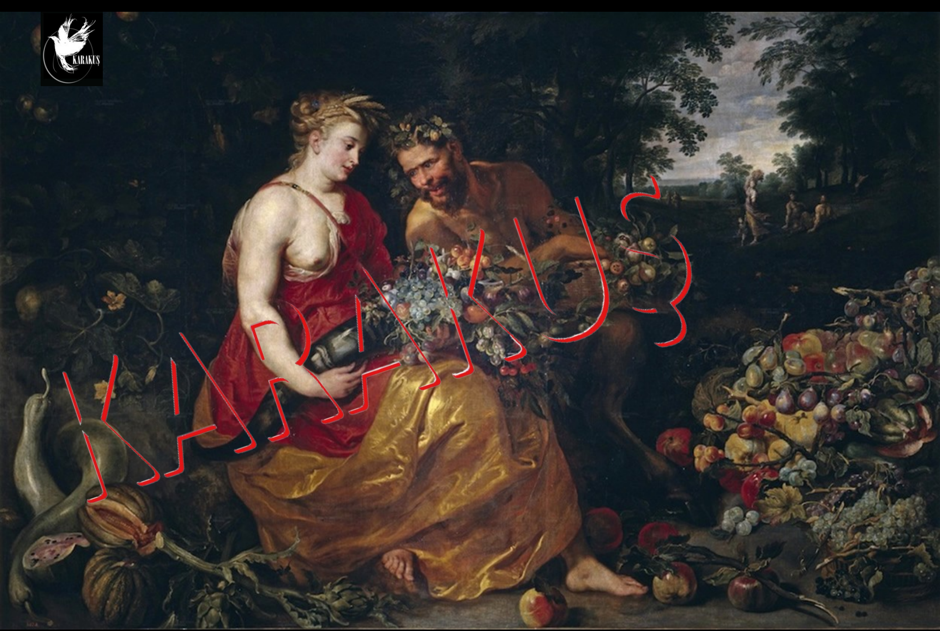
Demeter (Ceres) ve Pan