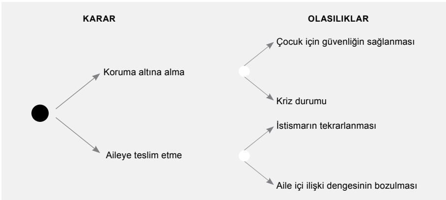
řekil 2. řans Olayları (Alınan karar sonucunda karřılařılabilecek riskler)

řekil 3'te de grlebileceęi gibi, sosyal hizmet uzmanı, ocuęun aileye teslimi ya da alternatif bir mdahale arasında karar verme durumundayken, karar analizi teknięi yardımıyla, nce her iki