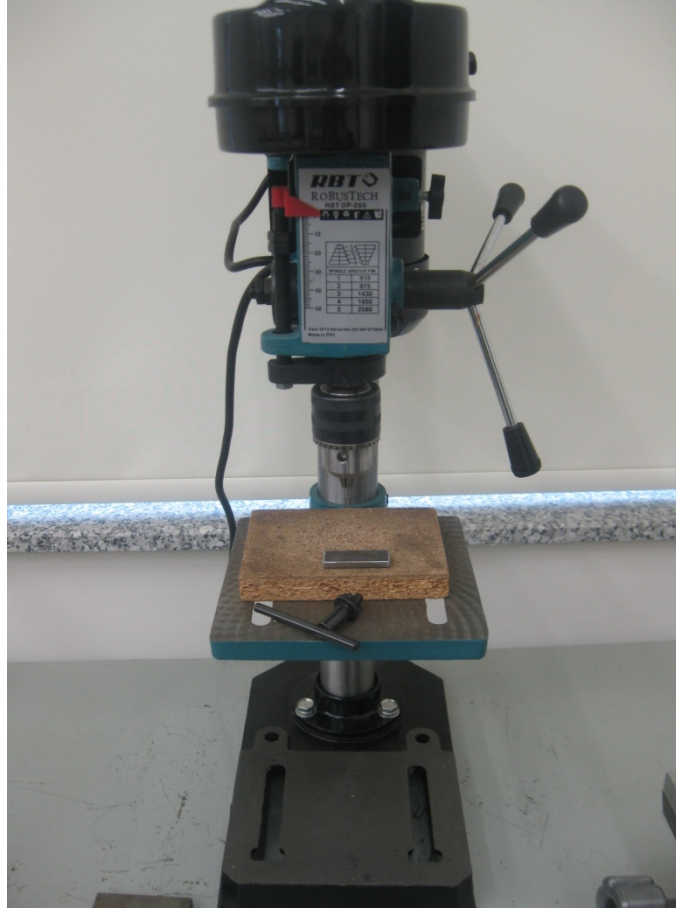
➤ Dikey Matkap

3-Metalde gerekli yerlere dikey matkap kullanarak delik açmayı öğrenir.