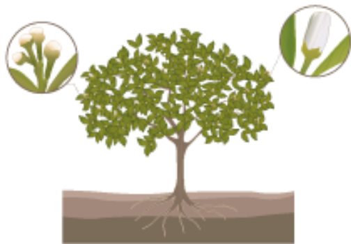
Pre - Bloom