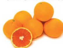
CARA CARA ORANGE

PEAK SEASON: JAN - MAY This cross breed is pink in color, very sweet and low acid. Excellent source of Vitamin C and dietary fiber. Pair with avocados, poultry, and strong cheeses.