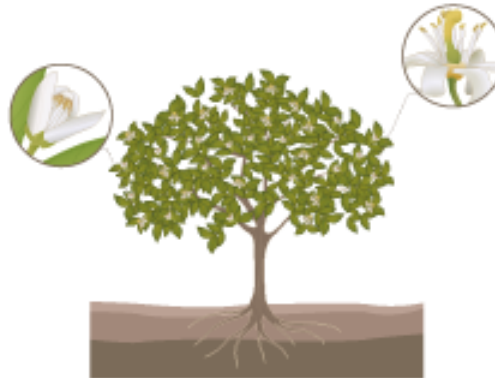
Full - Bloom