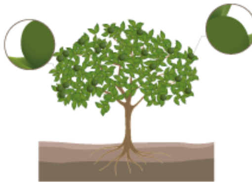
Fruit Growth (Until Colour change)