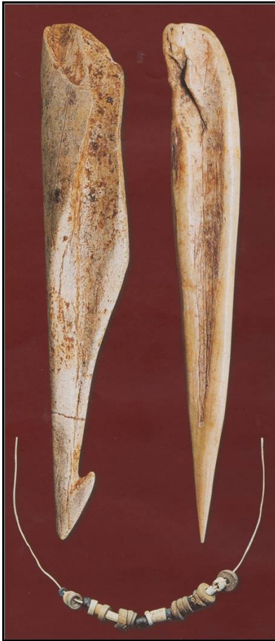
Resim 4: Öküzini Mağarası Kemik ve Boncuk Buluntular

kompozisyonlar insize çizgilerle işlenmiştir. Bir yüzünde dairemsi bir çizginin içinde yer alan 12 adet daire (hafifçe üçgenimsi) topluluğu tespit edilmiştir. Bu iri daire, düz çizgi motiflerinden oluşan “merdiven biçimli” kısma doğru yayılmaktadır. Benzer “merdiven biçimli” motifler, levha yüzeyi üzerinde bolca görünmektedir. İkinci yüzde, yatay sıralı 3 farklı blok oluşturan çizgiler, çentikler ve saç örgüsü gibi şekiller yer alır.