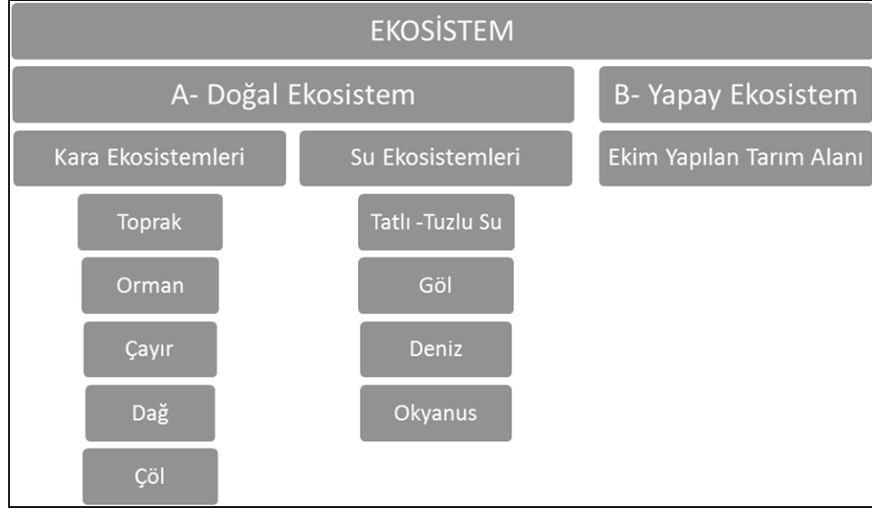
Şekil 5.1 Ekosistem çeşitleri

tanımlanmaktadır. Ekosistemler, canlı (biyotik) 16 ve cansız (abiyotik) 17 varlıklardan oluşmaktadır. Her ekosistem çeşidinin de kendine özgü farklı “fiziksel” ve “kimyasal” özellikleri bulunmaktadır. Ekosistem çeşitleri, Şekil 5.1’de yer almaktadır.