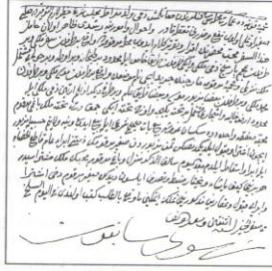
Şer'iyye Sicilli örneği

3- İdari Hükümler: Devletin teşkilatına, hazinesine, vergilerine ve reyaya ilişkin hükümler olup, bu alanda dini kuralların etkisi diğer alanlara göre daha azdır. 24