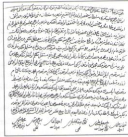
Şer'iyye Sicilli örneği

Yabancı bir hukuk sisteminin benimsenmesinde en belirgin özellik, benimsemenin isteyerek ve bilinçli bir şekilde iradi olarak yapılmasıdır. Bu nedenle benimseme, yabancı hukukun benimsetilmesi ve yabancı hukuka ile yabancıya ait olguların aktarılması farklıdır. Ya-