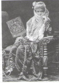
İzmirli bir kadın, (1890)

Türk çağdaşlaşmasındaki en önemli ve en keskin virajlardan biri olan Tanzimat Dönemi'nin, günümüze kadar devam eden olumlu etkilerinin bulunduğu bir ger-