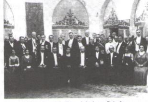
Gazi Mustafa Kemal Ankara Palas'ta, bir baloda. (1931)

Büyük Taarruz ile düşmanın yurttan çıkarılması ve ardından Lozan Barışının imzalanmasıyla dış sorunların büyük ölçüde çözümlenmesinden sonra Cumhuriyet ilan edilmiştir. Cumhuriyetin ilanıyla birlikte hemen her alanda köklü ve yapısal düzenlemelere hız verilmiştir. Bu düzenlemelerden hukuk sistemi de payını almış ve toplum yaşamını yeniden biçimlendirmeye başlamıştır.