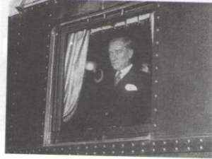
Gazi Mustafa Kemal'in Ankara'dan özel trenle hareketi. (1931)

Cumhuriyet döneminde çıkarılan kanunların tam olarak hayata geçmesi ve beklenen toplumsal faydanın sağlanması, yaklaşık 200 yıldır devam eden çağdaşlaşma süreciyle ilgili olarak ortaya çıkan temel sorunların da çözümünde ciddi bir yol gösterici olacağına kuşku yoktur.