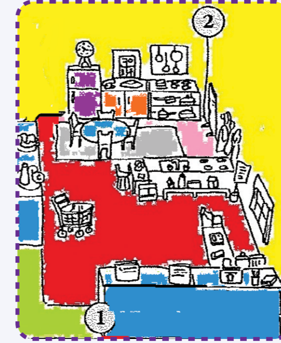
1. Giriş-Koridor/Blok Merkezi 2. Dramatik Oyun Merkezi

Bu ortamlarda dikkat edilmesi gereken nokta, öğrenme merkezlerinin birbirlerinden belirgin bir biçimde ayrılmış olmasıdır. Bunun amacı çocukların küçük gruplar hâlinde her bir öğrenme merkezinde daha etkin çalışabilmesini sağlamaktır. Öğrenme merkezleri birbirinden ayrılmış olsa da birbirinden kopuk ve bağımsız değildir. Çocuklar bir öğrenme merkezinde çalışırken diğerlerinde neler olup bittiğini kolayca takip edebilir. Bir öğrenme merkezinden diğerine erişim oldukça kolaydır. Öğrenme merkezleri birbirinden açık raf sistemine sahip, çocuk boyuna uygun dolaplarla ayrılmıştır. Dolapların çocuk boyuna uygun olması çocuğun çalışmak istediği materyale kendi başına ulaşması ve işini bitirince materyali yine kendi başına yerine kaldırması açısından önemlidir. Olası çarpma ve yaralanmaları önlemek için masa ve sandalyelerin kenarlarının sivri değil oval olmasına dikkat edilmelidir.