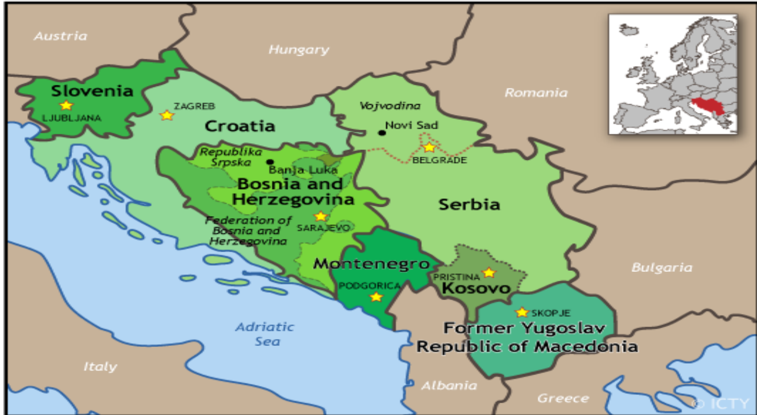
FORMER YUGOSLAVIA AS OF JANUARI 2008