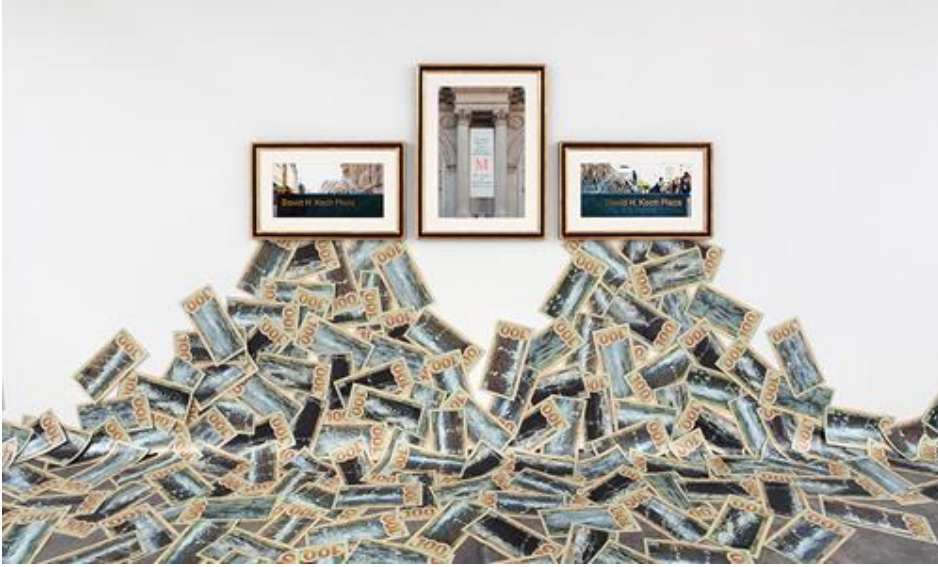
The Business Behind Art Knows the Art of the Koch Brothers, Haacke, 2014