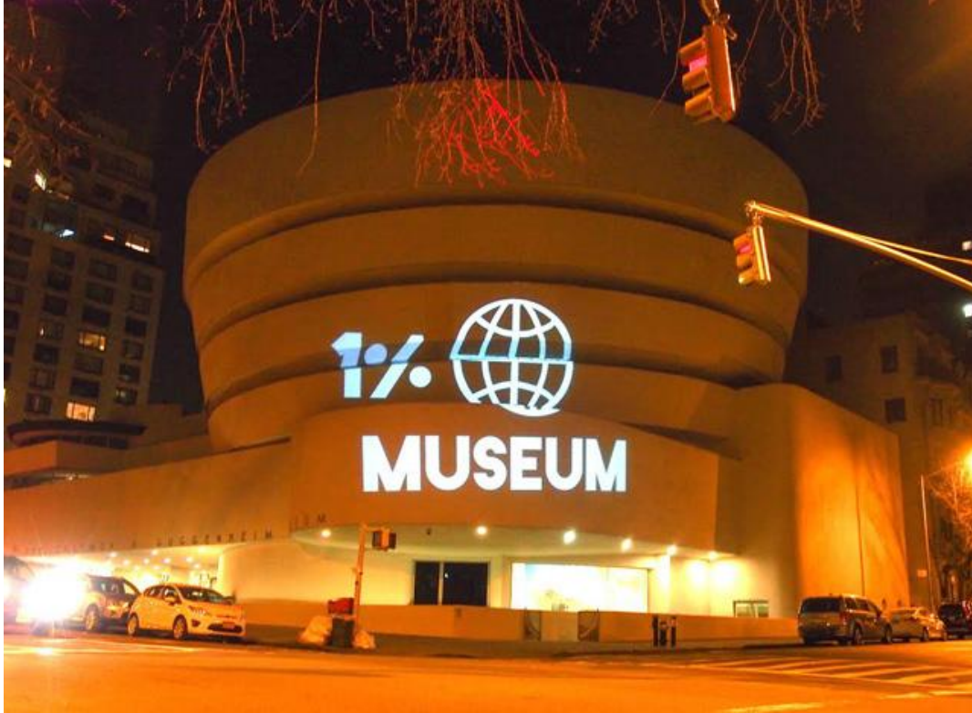
Global Ultra Luxury Faction (GULF), Guggenheim Protestosu, 24 Mart 2014