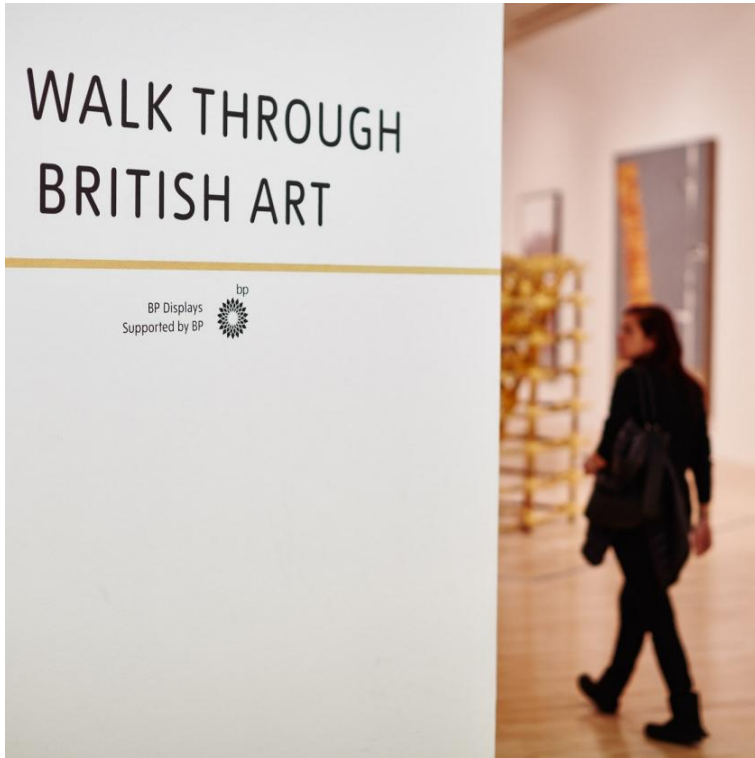
Tate Britain'da BP sponsorluğunda yapılan “Walk Through British Art” sergisi

ilişkisi, 2010 yılında yaşanan ve tarihin en büyük çevre felaketlerinden biri olan Meksika Körfezi petrol sızıntısıyla sorgulanmaya başlamıştır. 20 Nisan 2010 tarihinde BP'nin Meksika Körfezi'ndeki petrol tesisinde meydana gelen patlamada 11 işçi ölmüş ve 17 işçi yaralanmıştır. Sızıntı aylarca durdurulamamış ve 134 milyon varil petrol okyanusa sızmıştır. Altı yıl süren dava sonucunda BP, ABD'ye 20 milyar dolar tazminat ödemeye mahkum edilmiştir.[22] Bu tazminat bugüne kadar bir şirkete yüklenen en yüksek tazminat tutarı olarak tarihe geçmiştir. 20 milyar dolar tazminat ödemeye mahkum olan BP'nin Tate'e ödediği sponsorluk paraları ise gülünç mertebelere sahiptir. 26 Ocak 2014 tarihinde verilen mahkeme kararıyla Tate'in açıklamak zorunda kaldığı sponsorluk belgelerine göre, 1990-2006 yıllarını kapsayan 16 yıllık süreçte BP'nin Tate'e ödediği toplam sponsorluk ücreti yalnızca 3,8 milyon sterlidir. Ve yıllık ortalaması 224 bin sterline denk gelen bu tutar, Tate üyelerinin ödediği rakamların yanında son derece düşüktür. Yaklaşık 114.000 Tate üyesi sadece 2013-2014 yılında Tate'e 8,4 milyon sterlin bağışta bulunmuştur. Örneğin BP'nin 2006-2007 için ödediği sponsorluk ücreti Tate'in kendi elde ettiği gelirlerinin %0,74'ünü, toplam gelirlerinin ise yalnızca %0,437'sini oluşturur. [23] Bu miktarlar düşünüldüğünde hangi kurumun diğerine daha çok katkı yaptığı cevaplanması gereken bir sorudur.