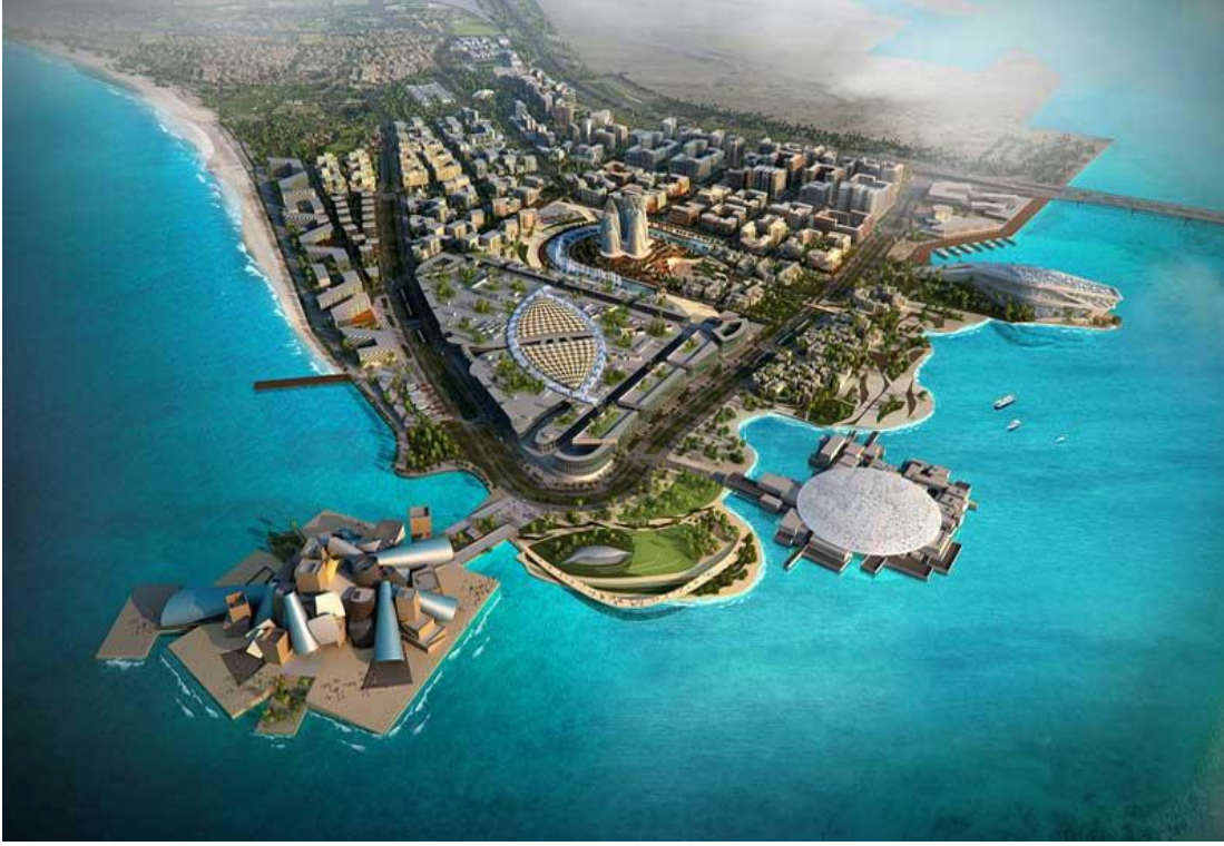
Saadiyat Adası projesinde yer alan Guggenheim Abu Dhabi ve Louvre Abu Dhabi

Sanatçılar, akademisyenler, küratörler, yazarlar ve eylemciler tarafından kurulan Occupy Museums, Liberate Tate ve Gulf Labor, hedefleri ve eylem pratikleri farklı olsa da, günümüz müzeciliğinin temelde neoliberal rejimlerden kaynaklanan sorunlarına dikkat çekme amacındadırlar.