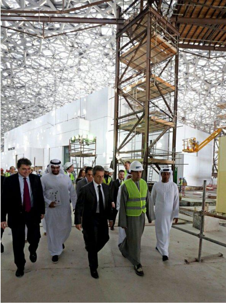
Nicolas Sarkozy, eski Cumhurbaşkanı sıfatıyla Louvre Abu Dhabi inşaatını denetlerken, 13 Ocak 2016

yapılan askerî anlaşmalar sonucu Abu Dhabi'de Louvre'dan önce bir Fransız askerî üssü açılmıştır. Açılışı yapan dönemin Cumhurbaşkanı Nicolas Sarkozy, Louvre Abu Dhabi inşaatını da yerinde denetlemiştir.[6]