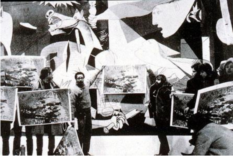
Art Workers' Coalition üyelerinin MoMA'da sergilenen Guernica önündeki protestosu, 1970

24 Şubat 1980'de bir grup sanatçı ve aktivist tarafından Manhattan'da bir kitapçıda kurulan Political Art Documentation/Distribution (PAD/D, Politik Sanat Dokümantasyonu/Dağıtımı) yayınladığı ilk bültende hem ticari hem de kâr amacı gütmeyen sanat kuruluşlarına karşı çıkıyor ve hedeflerini şu şekilde sıralıyordu: