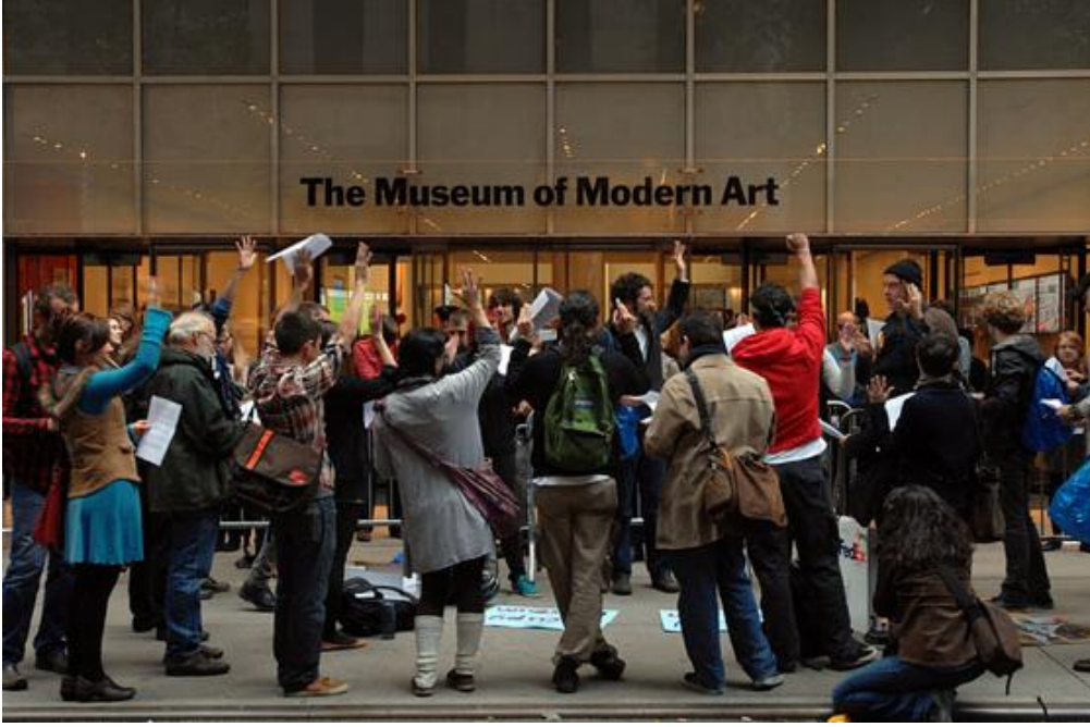
Occupy Museums eylemcileri MoMA önünde

17 Eylül 2011 tarihinde işgal edilen Zucotti Park ile başlayan Occupy Wall Street eylemleri kısa sürede kendi içerisinde farklı gruplar çıkardı. Occupy Museums da ilk eylemini Zucotti Park işgalinden yaklaşık 1 ay sonra, 20 Ekim 2011 tarihinde MoMA önünde gerçekleştirdi.[19]