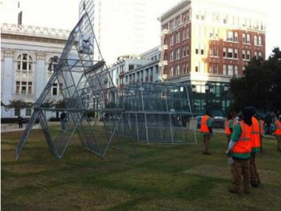
Occupy Oakland işgalleri sırasında sanatçılar tarafından heykele dönüştürülen polis bariyerleri, 2011