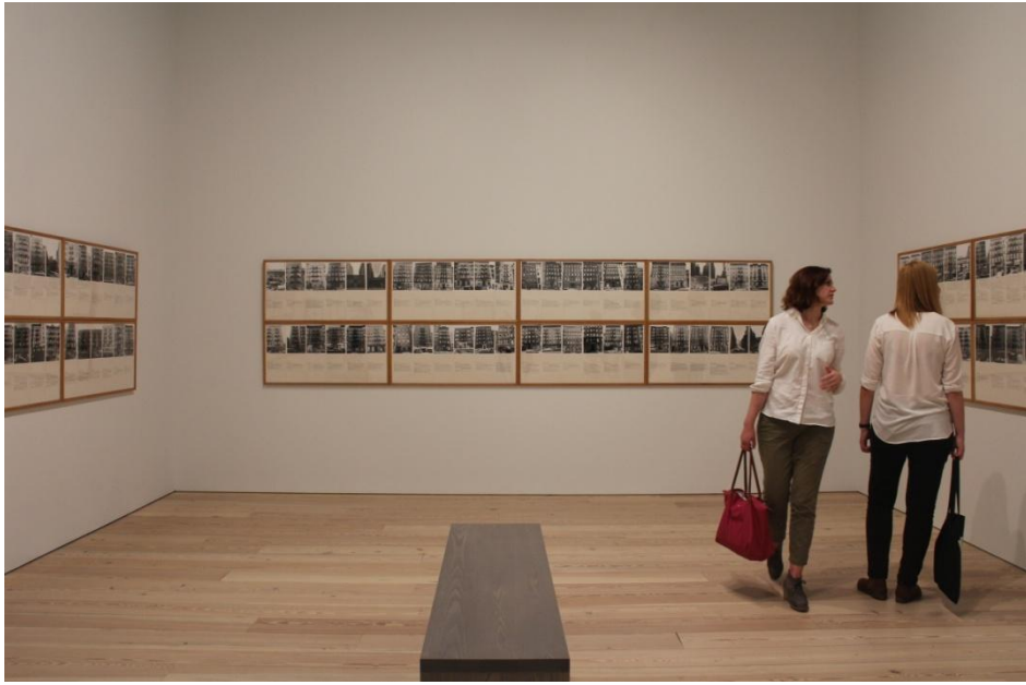
Shapolsky et al. , Haacke, 1971; Whitney Müzesi, 2015

1849 yılında Prusya askerî birlikleri, Dresden'deki sosyalist direnişini bastırmak istediğinde, Mihail Bakunin direnişçilere Ulusal Müze'deki yağlıboya tabloları barikatların önüne yerleştirmeyi önermişti.[9] Hans Haacke gibi sanatçılar belki Bakunin'in önerdiği gibi sanat eserlerini barikatların önüne asmamıştır. Fakat eylemleri, aldıkları tavırlar ve ürettikleri eserlerle direnişini, barikatları müzelerin içine taşımışlardır. Müze politikalarının otoriterliğine karşı örgütlenen “sanat emekçileri”, Haacke'nin izinden giden sanat direnişçileridir. Haacke sanatını protestoya dönüştürürken, sanatçılar da eylemleriyle protestoyu sanatlaştırmışlardır.