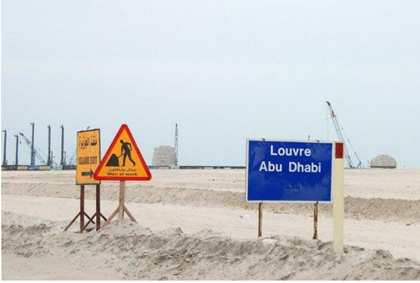
Louvre Abu Dhabi inşaatı, 2011