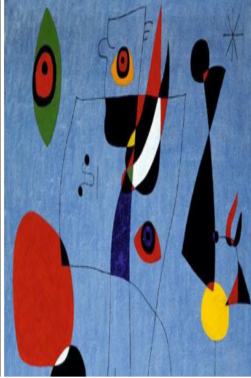
Miro Temalı Oyun, Sabancı Müzesi