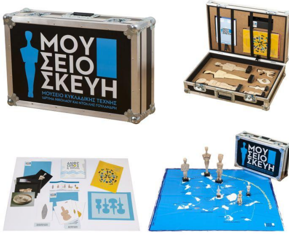
Kiklad Sanatlar Müze bavulu, Yunanistan