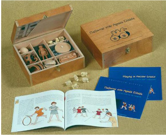
Yunan Arkeoloji Müzesi, Yunanistan