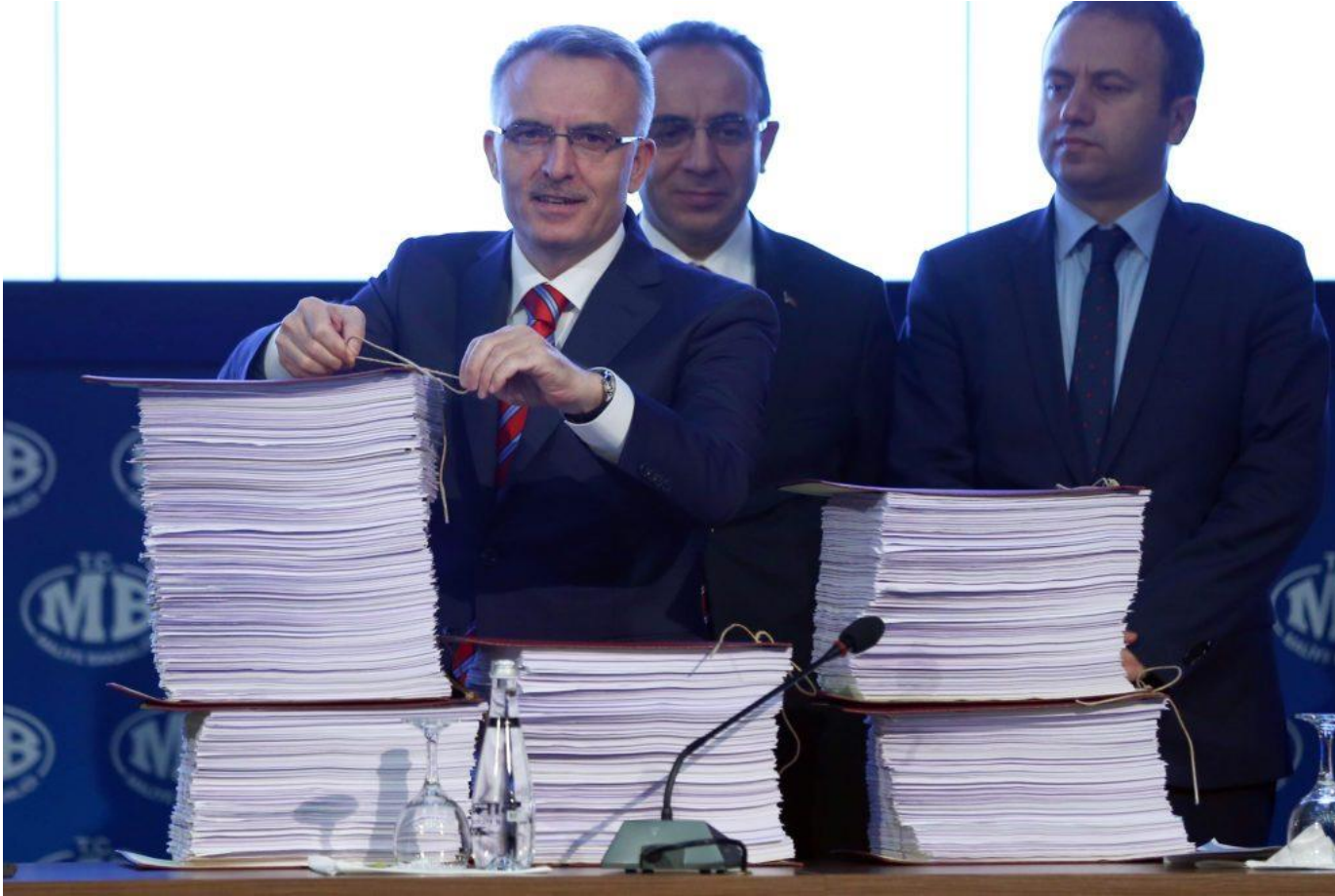
Maliye Bakanı Naci Ağbal, Ocak-Eylül 2016 Dönemi Merkezi Yönetim Bütçe Uygulama Sonuçları, 2016 Yılı Sonu Bütçe Gerçekleşme Tahmini ve 2017 Yılı Merkezi Yönetim Bütçe Kanun Tasarısı hakkında Maliye Bakanlığı'nda basın toplantısı