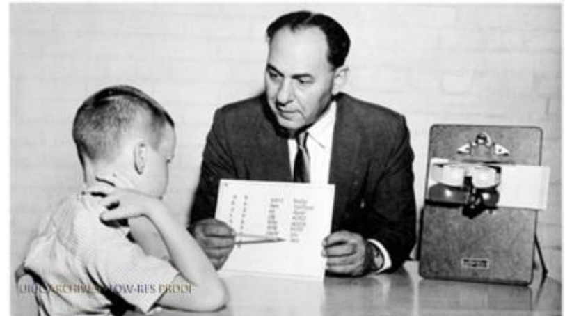
...Dr. Samuel A. Kirk gives a child the mirror reading test.