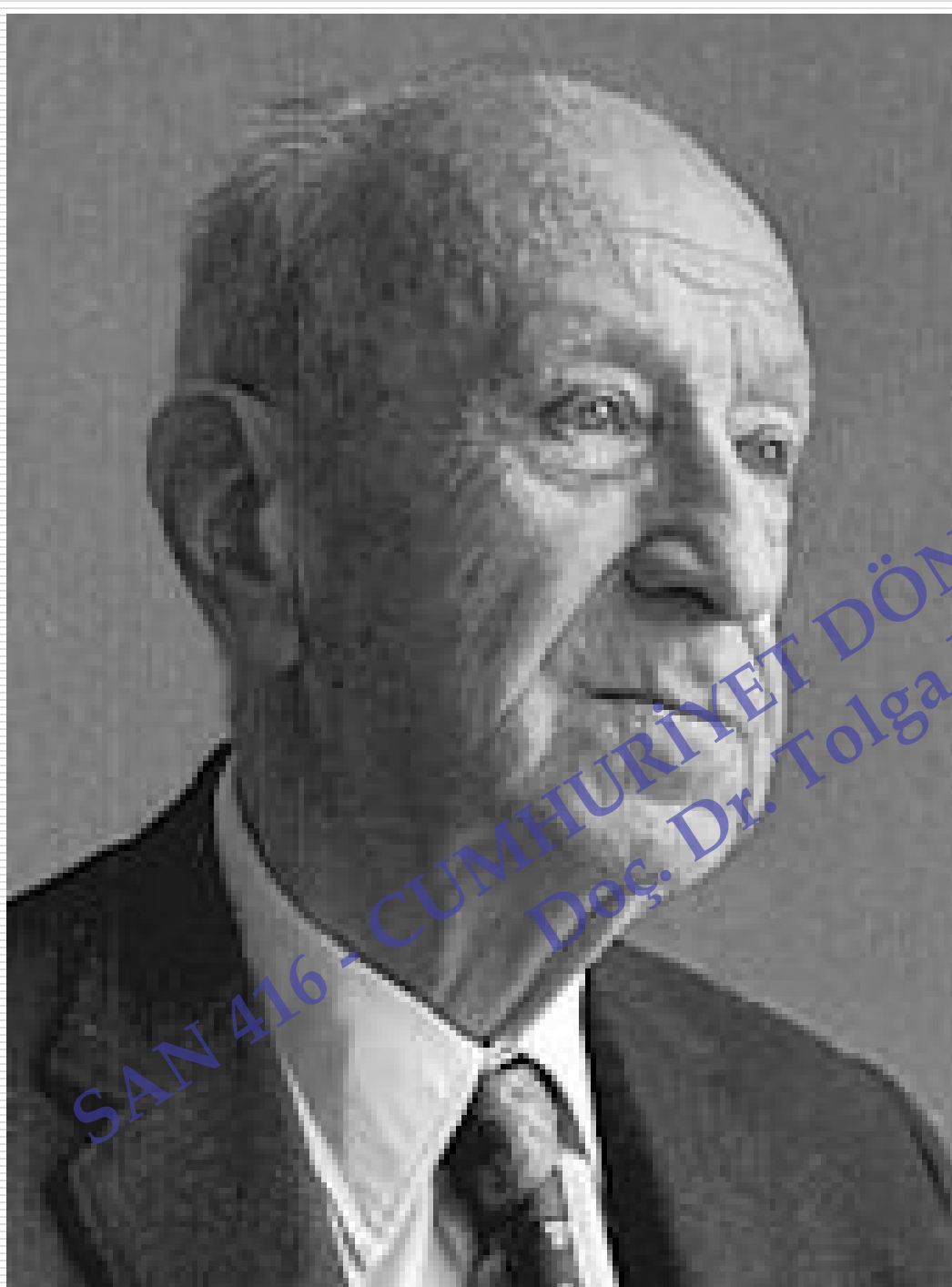
Mimar Arif Hikmet Koyunođlu (1888 – 1982)