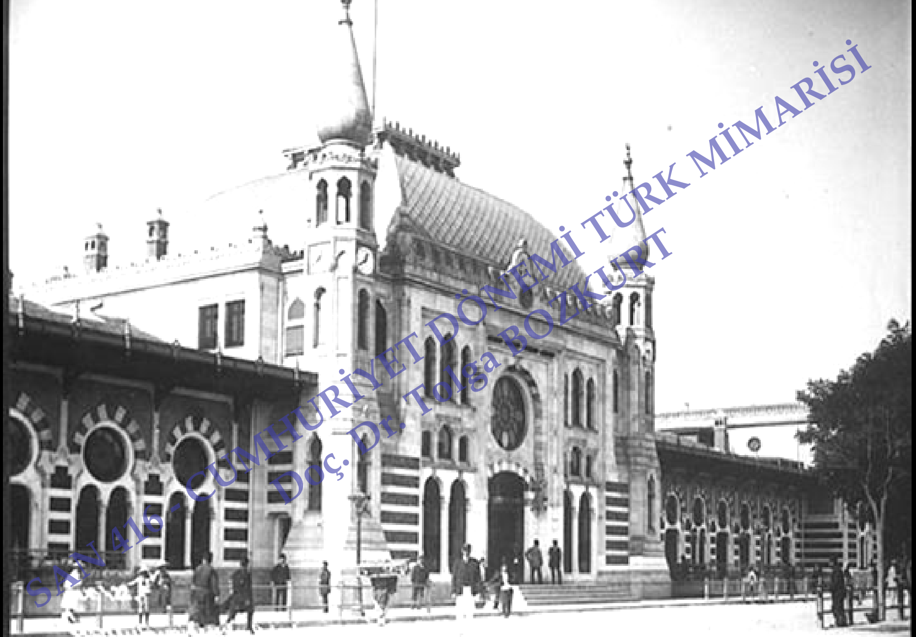
Sirkeci Garı, kuzey cephe