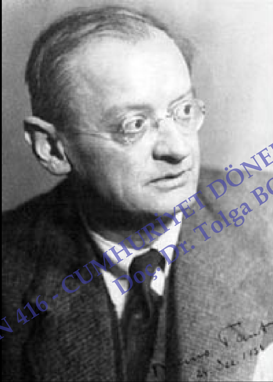
Bruno Taut (1880-1938)