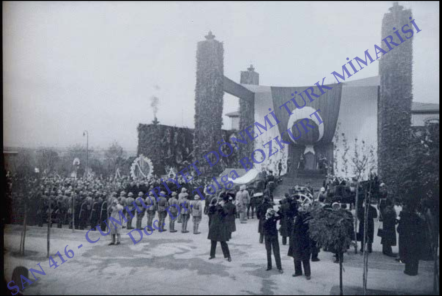
Atatürk'ün Katafalkı, 1938, Bruno Taut