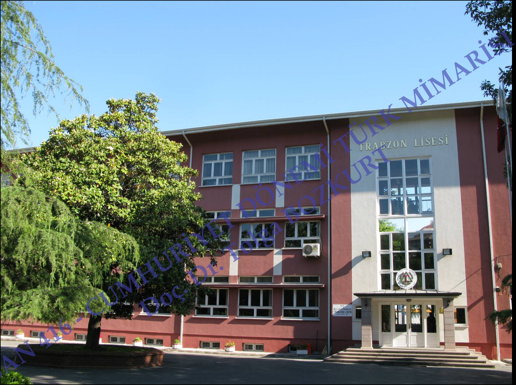
Trabzon Lisesi, 1938, Bruno Taut