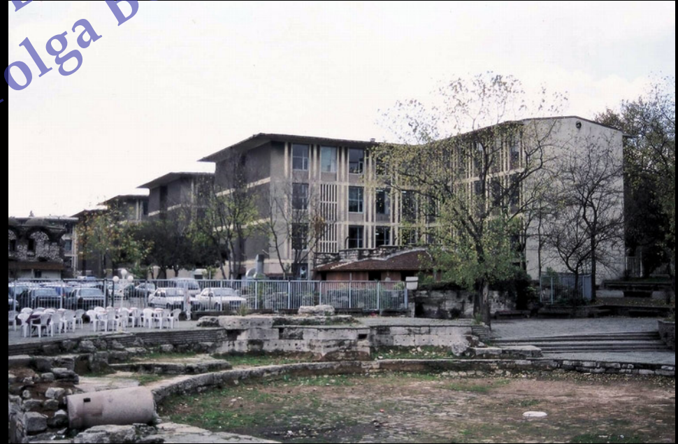
İstanbul Adliyesi, 1949, S.H. Eldem - O. Arda