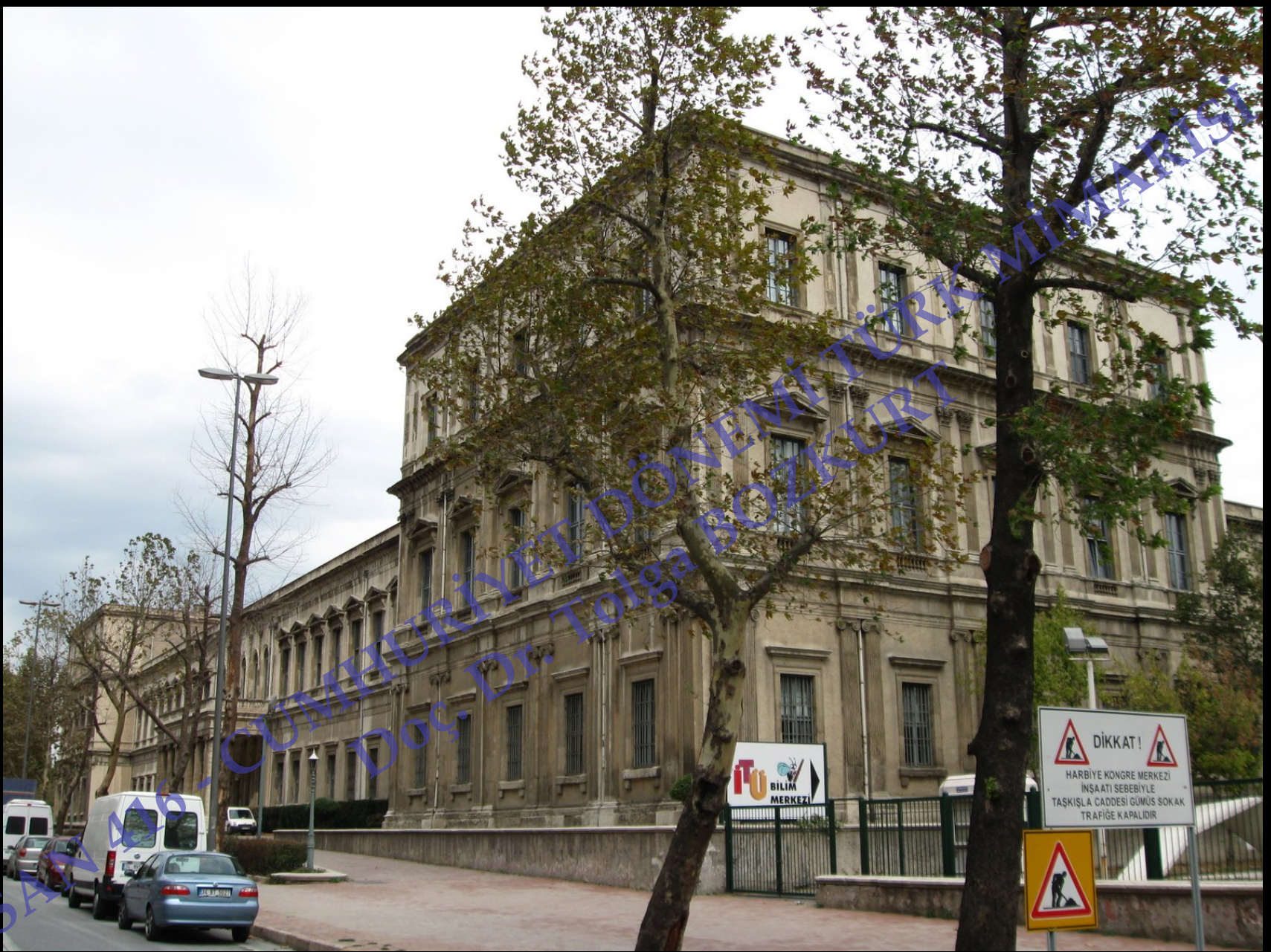
İstanbul Taşkışla (b. İTÜ Mimarlık Fakültesi), 1943-44 onarım çalışmaları, Paul Bonatz Emin Onat ile birlikte