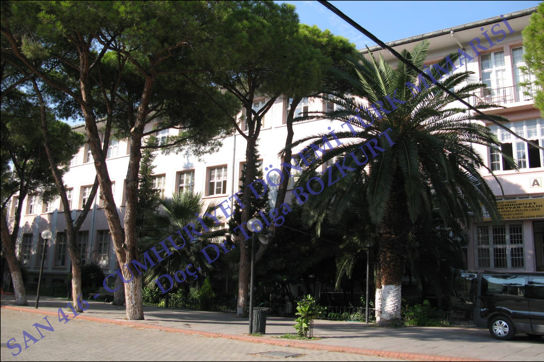
İzmir Cumhuriyet Kız Enstitüsü, 1938, Bruno Taut