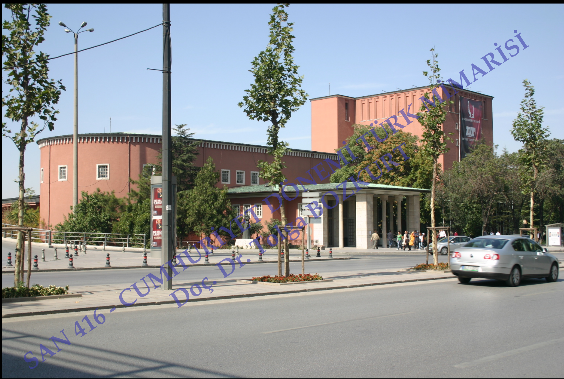
Ankara Devlet Opera Binası (Eski Sergi Evi 1934, Ş. Balmumcu), 1948, Paul Bonatz