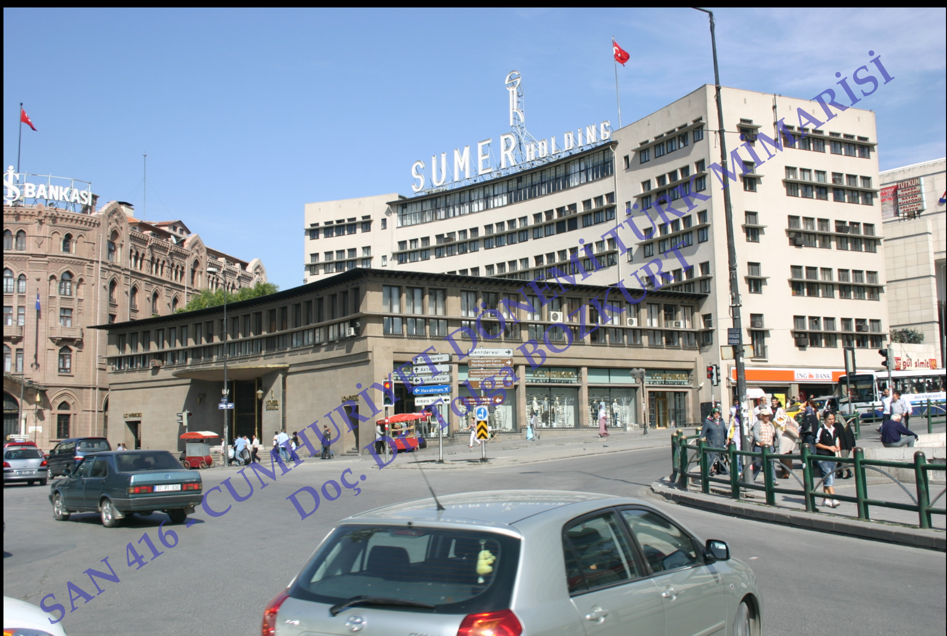
Sümerbank Genel Müdürlüğü, 1936, Martin Elsaesser