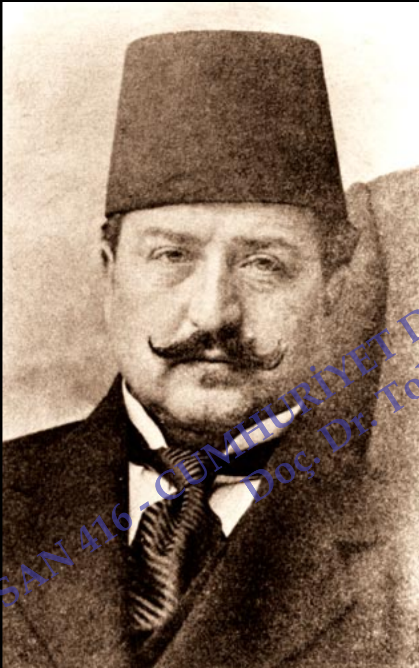
Mimar Ahmet Kemalettin Bey, 1870-1920