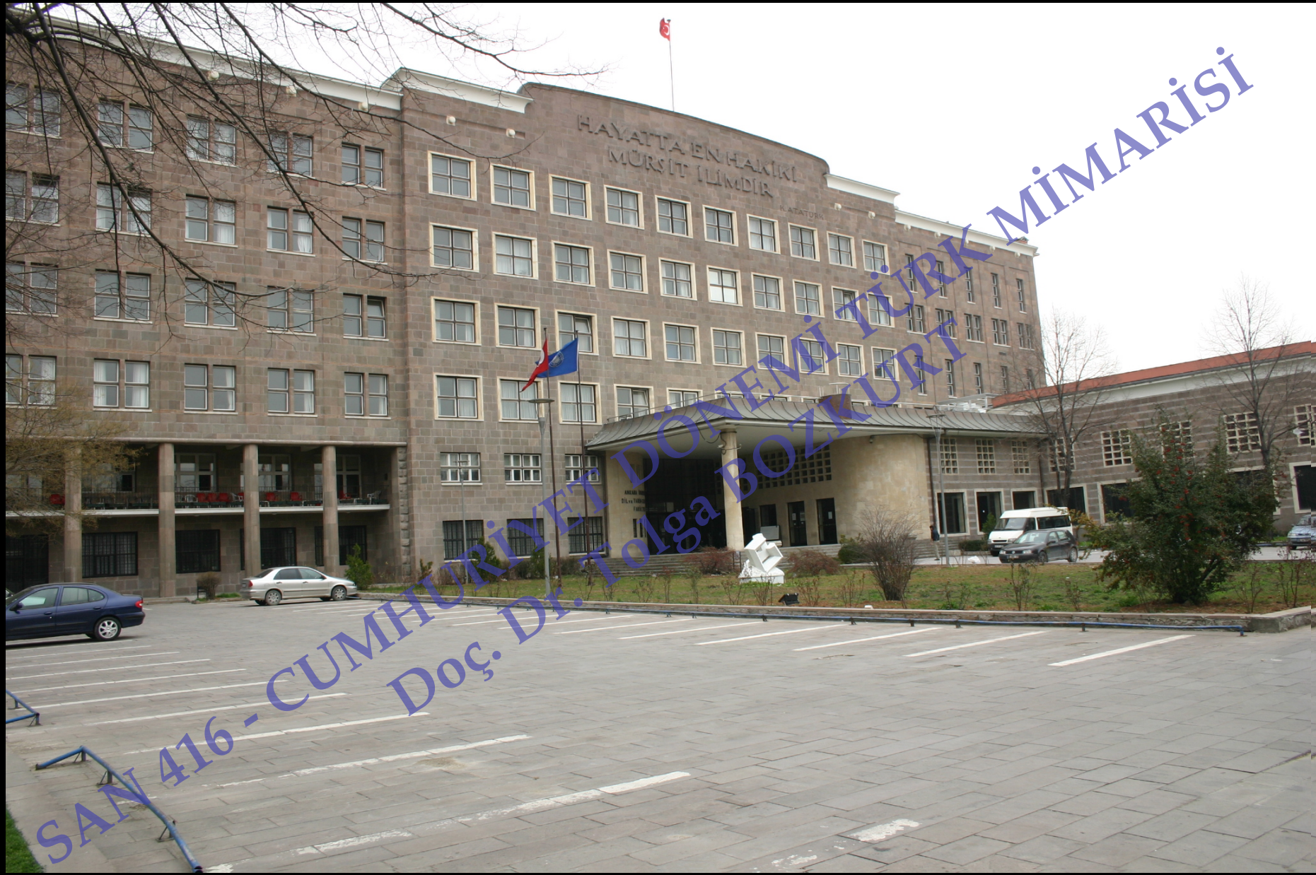
Ankara Üniversitesi Dil ve Tarih-Coğrafya Fakültesi, 1936-38, Bruno Taut