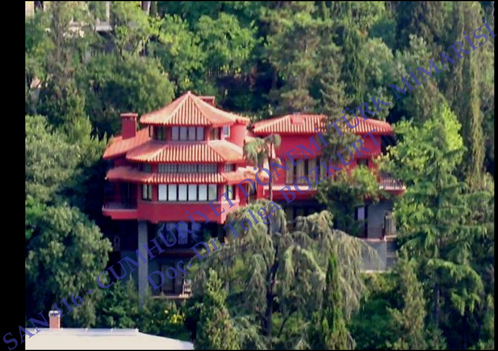
İstanbul-Ortaköy'de Bruno Taut Evi, 1938