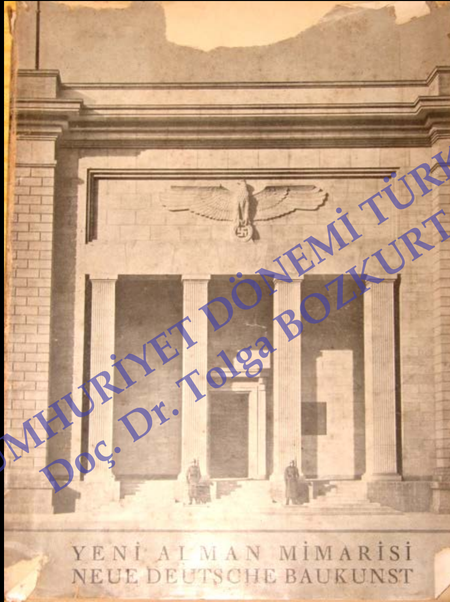
Albert Speer, Yeni Alman Mimarisi, Berlin, 1942