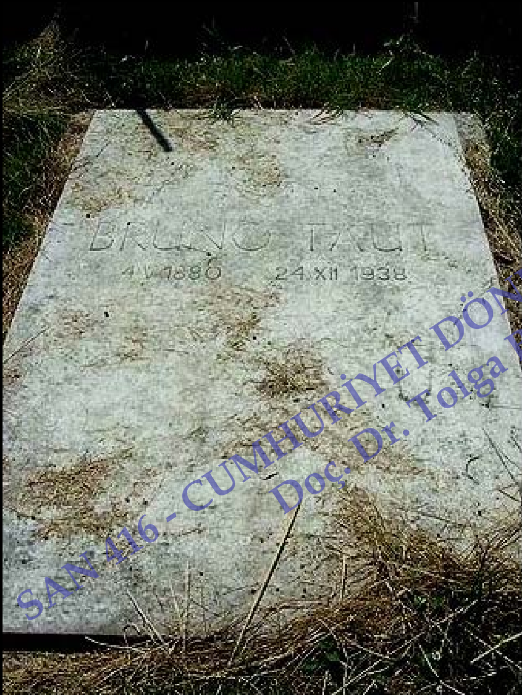
Bruno Taut'un İstanbul Edirnekapı Mezarlığındaki mezar taşı