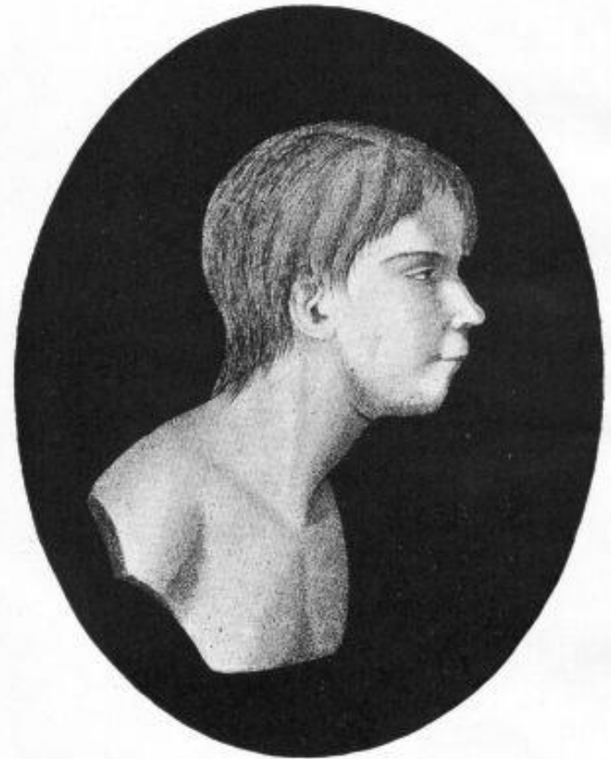
Der Wilde von Aveyron.