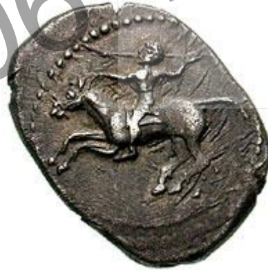
Mopsos = Aspendos şehri