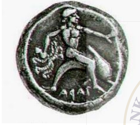
Taras = Tarentum şehri