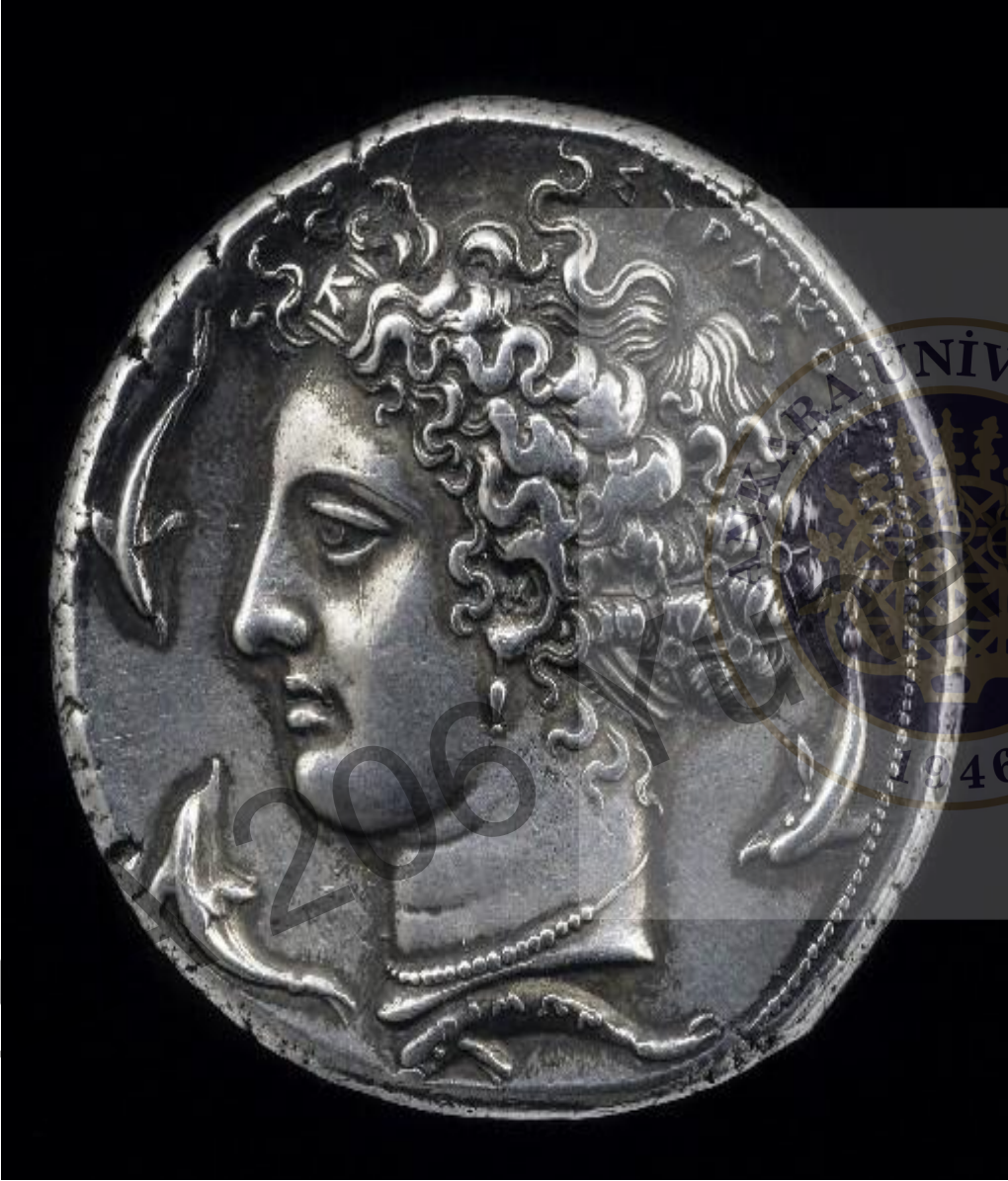
Syracusai = Kimon