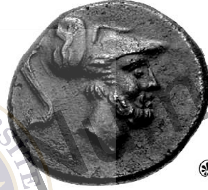
Leukippos = Metapontum şehri