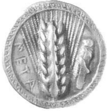
Buğday Başağı/ Metapontum