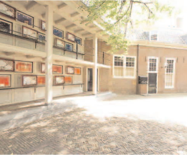
Amsterdam Tarih Müzesi

S on yıllarda dünyanın birçok köşesinde yeni yeni kent müzeleri kuruluyor ya da 19. yüzyıl sonları ile 20. yüzyıl başları arasındaki dönemde ortaya çıkan ilk kuşak kent müzeleri büyük yatırımlarla kendilerini içerik olarak yeniliyorlar ve geçmiştekenden çok daha geniş mekânlara taşınıyorlar. Örneğin, şu sıralarda Venedik’te, Sao Paolo’da, Cardiff’te, Essen’de, Cape Town’da, Toronto’da, Pekin’de yeni müzeler kuruluyor, Moskova’da, New York’ta, Liverpool’da, Bristol’de, Roma’da, Singapur’da, Boston’da, Chicago’da daha önce var olan kent müzeleri, Yeni Müzecilik akımının getirdiği büyük rüzgârla farklı ihtiyaçları dikkate alarak, yeniden örgütleniyorlar. Bu değişimi son on yılda yaşayan Londra, Seul, Bogota, Montreal, Osaka, Sydney, Kopenhag gibi örnekler de listeye eklendiğinde, kent müzeciliği alanında, zaten hızlı bir dönüşüm içinde olan müzecilik sektörünün genel ortalamasını da aşan hızlı bir gelişme tablosu göze çarpıyor.