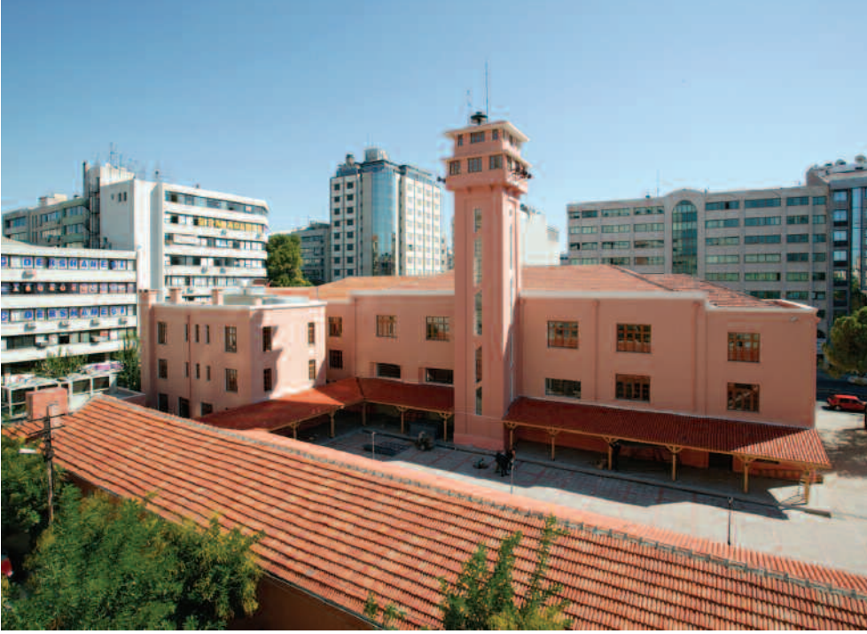
İzmir Ahmet Piriştina Kent Arşivi ve Müzesi

kadar ilişkili olduğu sorulabilir. Bu sorunun cevabı, bir bütün olarak kentin gelişimini değil, bazı ailelerin yaşam, gelenek ve göreneklerini sergilemeyi amaçlayan sergilerin, birçok arkeoloji müzesindeki özel bölümlerin ve az sayıdaki etnografya müzesinin kent müzelerine komşu, ancak bütünüyle ayrı bir müze kategorisi olduğudur.