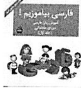
کتاب فارسی - زبان فارسی