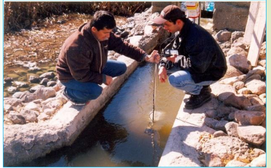
Çerkeş deresi, Çankırı