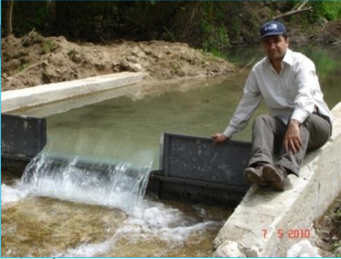
Nasrettin Hoca Kaynađı, Sivrihisar