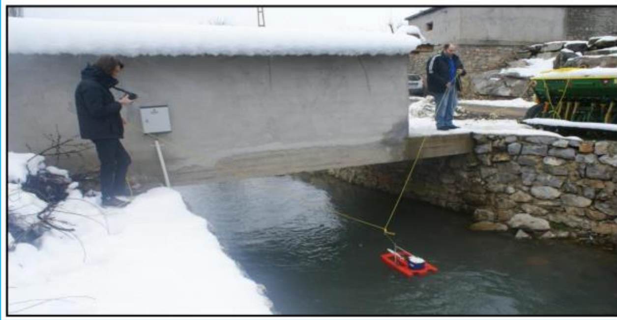
Pınarbaşı Estavelle, Seydişehir, Konya