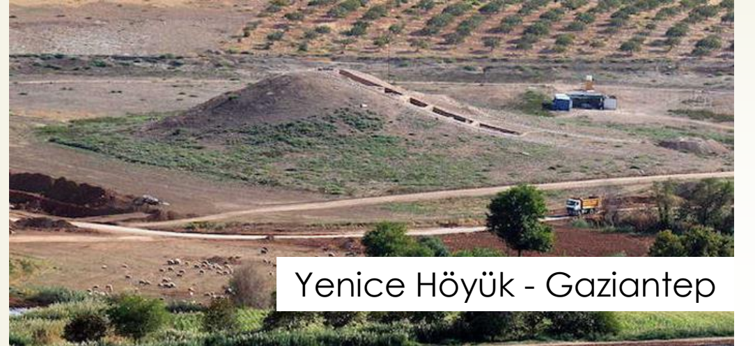
Yenice Höyük - Gaziantep