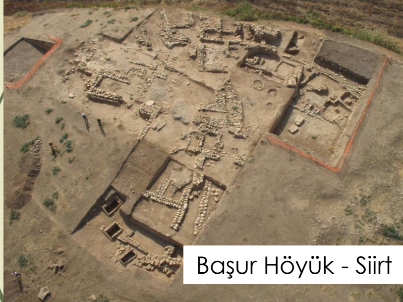
Başur Höyük - Siirt