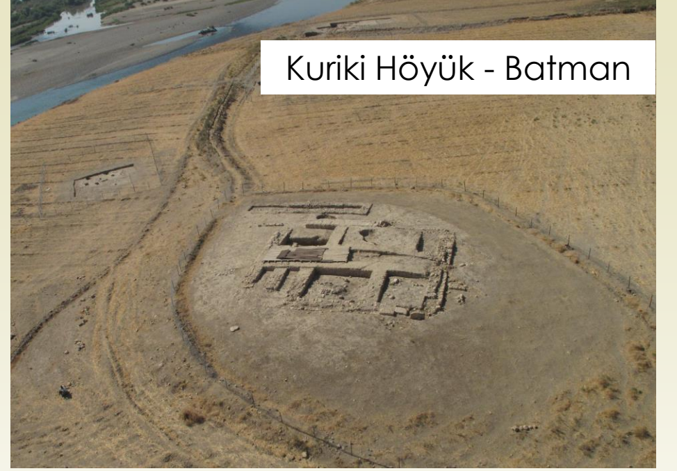
Kuriki Höyük - Batman