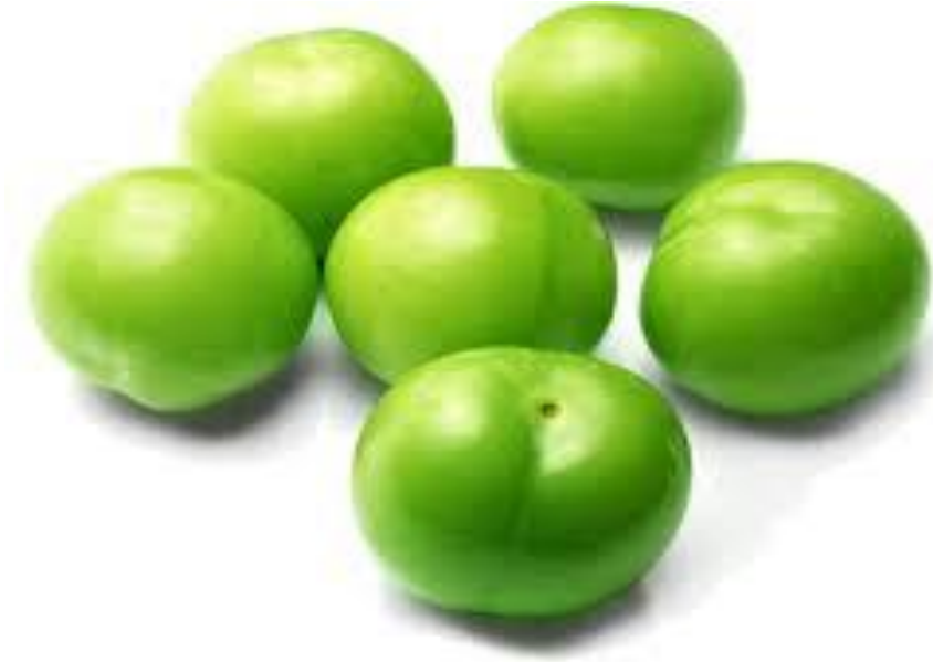
آلو بخاره آلوچه ālūbuḥārā ālūḥah