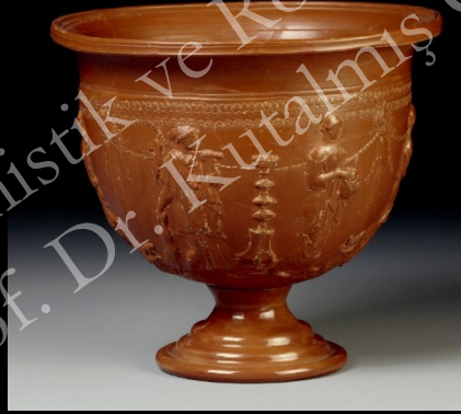
Roma'nın Yükselişi: Batı Sigillatları ve Kurşun Sırlı Kaplar