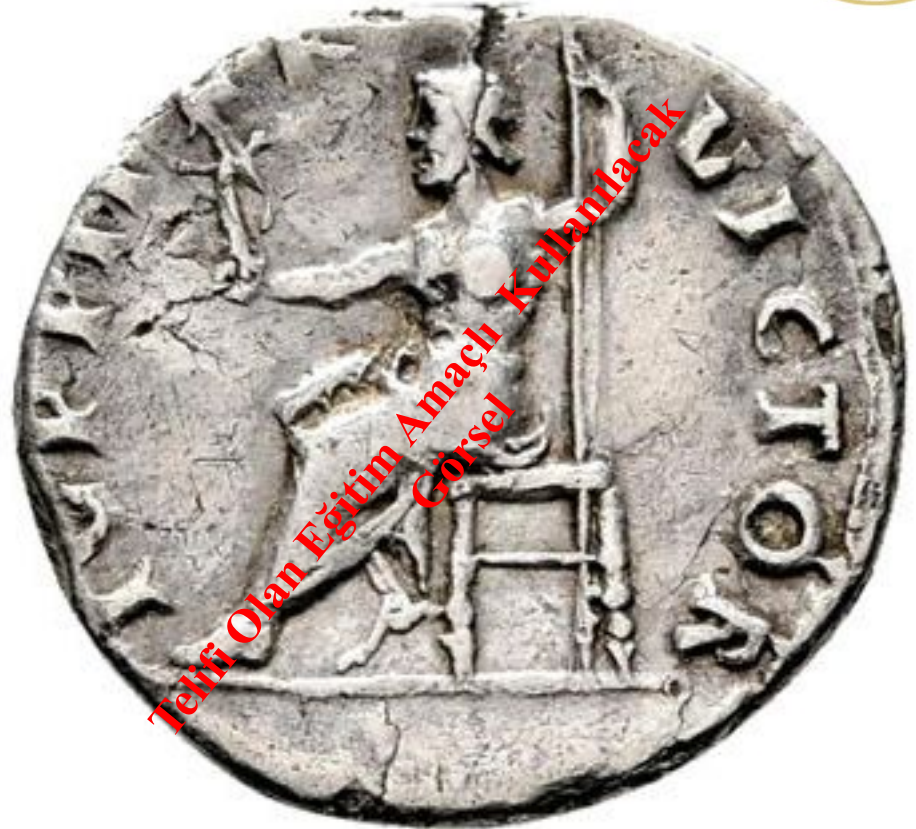
İmp. Vitellius Dönemi Denarius. MS 69