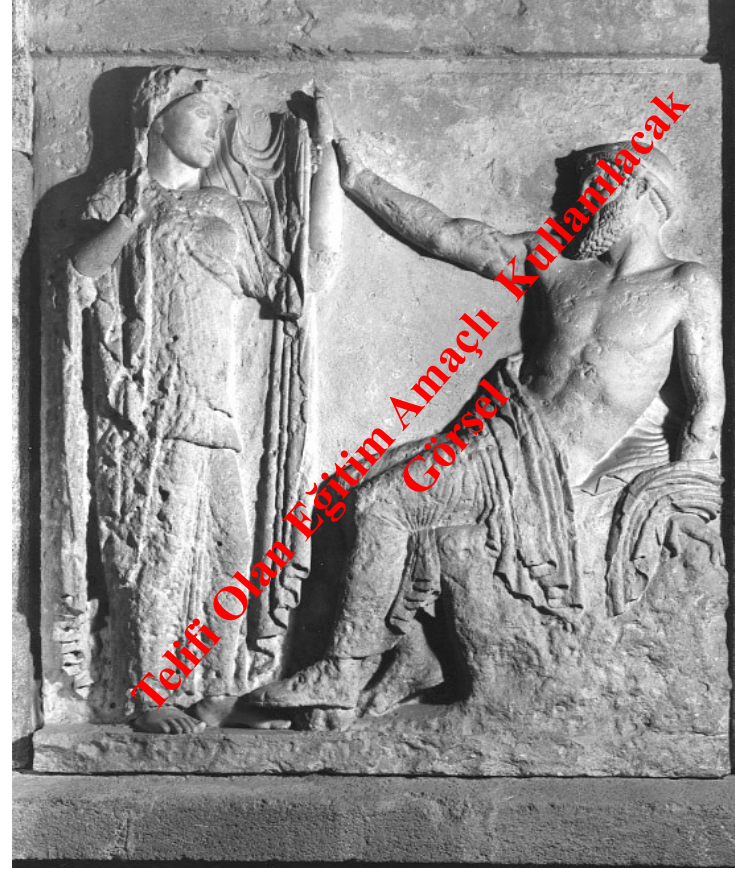
Selinus E Tapınağı Metobu, Hera ve Zeus MÖ 475

Zeus'un tanrıça Hera ile olan evliliği Yunan İkonografisinde MÖ 7. yy'ın sonundan itibaren görülmektedir. En erken örneklerden biri Samos'da bulunmuş olan ahşap levha üzerinde Zeus ve Hera'nın temsil edilmesidir (MÖ 610-600). En bilinen örneklerden biri Selinus'daki E Tapınağı Metobu'dur. (MÖ 475). Yunan vazoları üzerinde de bu betimleme yer alır. Heimarmene Ressamı'nın Pyxis üzerinde Zeus ile Hera'nın evliliği anlatılmaktadır (MÖ 450-400).