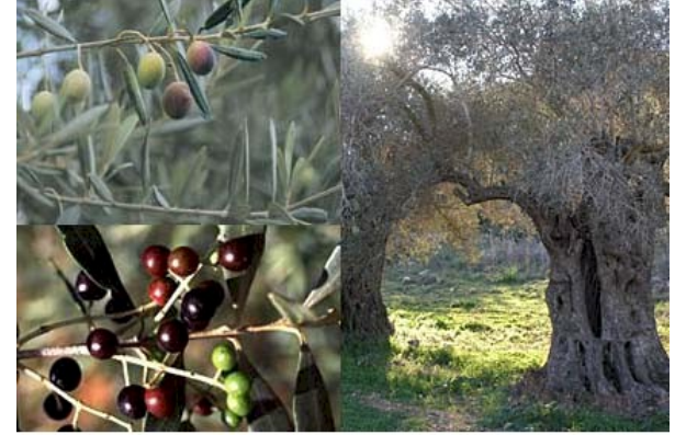
OLIVE TREE Olea europaea

Gökyüzünün ve Olympos'un baş tanrısı olan Zeus Kronus ile Rhea'nın oğludur. Tanrının sembolleri arasında asa ve yıldırım demeti yer almaktadır. Ayrıca taht ve başında zeytin dalından yapılmış bir taç taşımaktadır. Kutsal hayvanları kartal ve boğadır. Kutsal bitkileri Meşe ve zeytin ağacıdır. Kendisi birlikte yanında Hermes, Nike, Kratus, Themis, Moiralar (kader tanrıçaları), Horalar (mevsim tanrıçaları) bulunmaktadır. Roma döneminde Jüpiter ismiyle anılmaktadır.