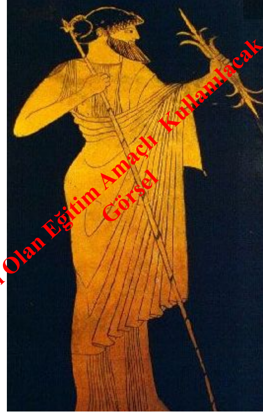
Zeus, Atina Kırmızı Figür Teknikli Panathenaik Amphora MÖ 5. yy. Berlin Antiken Sammlung