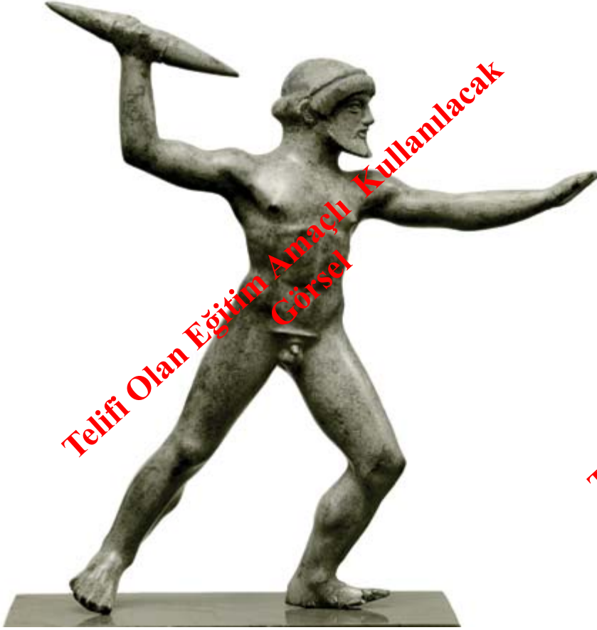
Bronz Zeus Heykelciği, Dodona, Yunanistan MÖ Erken 5. yy. Berlin Staatliche Museen.