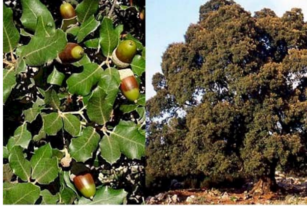
HOLMOAK Quercus ilex