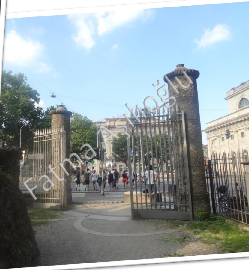
Milano Montanelli Parkı Kapısı