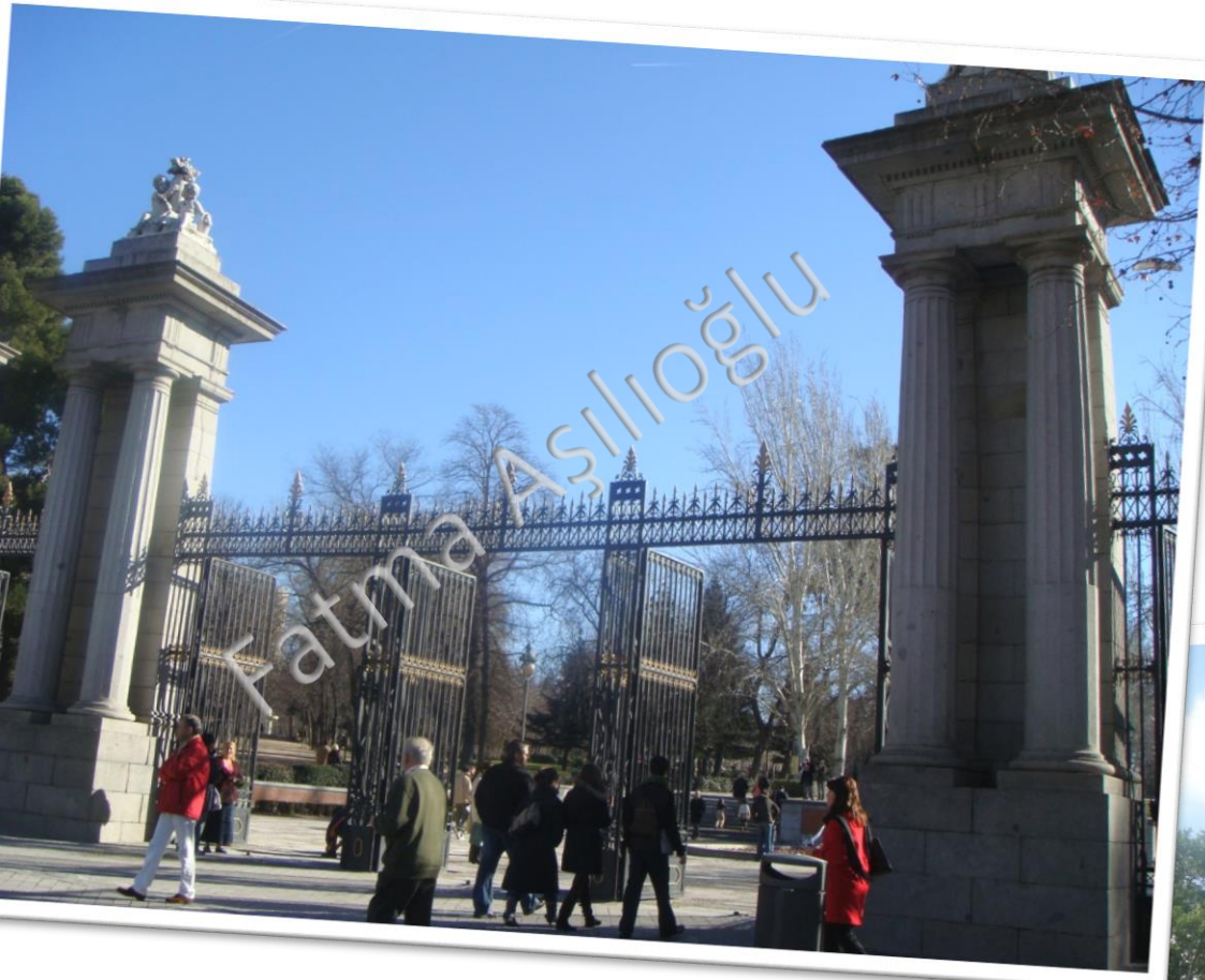
Madrid Retiro Park Kapısı