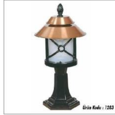
Baba üzeri aydınlatma