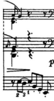
Örnek 5-b: (4. ölçü)

Prelüd'ün giriş ana temasını takip eden bu 2. ve 4. ölçülerde, edisyonlarda küçük ama üzerinde çarpma çizgisi olmadan sekizlik şekilde yazılı mi bemol ve la bemol notaları, kesinlikle çarpma değildir. Bu küçük notalar çoğunlukla apojiyatürleri belirtmek için kullanılır ve tam anlamıyla süs sayılmazlar. Çeşitli edisyonlar incelendiğinde bu pasajın iki şekilde çalınabileceğini anlarız. Örnek 4 ve Örnek 5'in a ve b'lerinde aynı pasajın iki farklı açılımı verilmiştir. Her iki açılım da apojiyatür karakterini vermektedir. Ancak tercih edilmesi gereken bu örneklerin b'lerindeki olmalıdır. Bunun sebebi, küçük notanın dörtlük değil sekizlik yazılmış olması ile, bize kısa değerli bir nota olacağı sinyalini vermesidir.