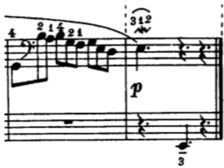
Örnek 11-b: (70-71. ölçüler)

Prelüd bölümünün son iki ölçüsü yukarıda iki farklı şekilde verilmiştir. Fark edileceği gibi son iki mi bemol notaları, a ve b örneklerinde farklı ellere verilmişlerdir. Burada tercih icracıya kalmıştır. Fakat artikülasyonunun bozulmaması ve cümlelemenin bölünmemesi için, sağ el çizgisinin son notasının Örnek 11-b'deki gibi yine sağ el ile çalınması daha uygun olacaktır. Sonuçta bu nota, önceki çizgiye aittir ve kalın mi bemol notası tek başına kalmalıdır.