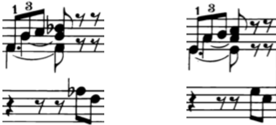
Örnek 9-a: (26. ölçü) Örnek 9-b: (28. ölçü)

Örnek 8'in sağ elinin ikinci ölçüsündeki trill, her ne kadar Barok dönemde triller genellikle üstten başlasa da, burada esas notadan başlanmalıdır. Çünkü burada trill eğer üst sestem (mi bemol) başlarsa, trilden önceki nota ile (yine mi bemol) aynı olacağı için çiftlenecektir. Bu da hem iyi duyulmayacak hem de icra zorluğu getirecektir.