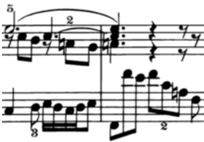
Örnek 6: (9-10. ölçüler)

Her iki durumda da dikkat edilmesi gereken bir husus da, apojiyatür mi bemol ve la bemol notalarının, tam vuruş başında denk gelmesi, sol elin ve sağ eldeki akorun diğer sesleri ile aynı anda çalınması gereğidir. Böylelikle sağ elde ölçü başında net bir şekilde Örnek 4'te fa-mi bemol akoru, Örnek 5'te ise si bemol-mi bemol-la bemol akoru tınlayacaktır.