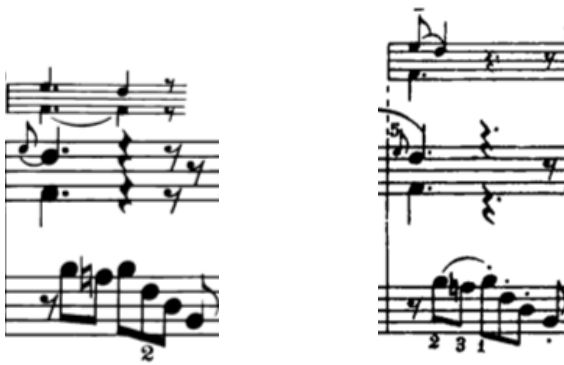
Örnek 4-a: (2. ölçü)

50. ölçünün son vuruşunda si bemol üzerindeki mordan süslemesi, genellikle Örnek 3'te açılımı verildiği gibi çalınmaktadır. Bu mordan (ve tüm mordanlar), açılımda belirtildiği gibi, Romantik dönem mordan ve süslerinden farklı olarak direkt olarak vuruş başında ve sol elin ilk sekizlik notası ile aynı anda başlamalıdır.