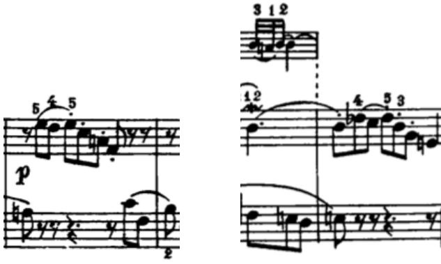
Örnek 2: (25. ölçü)