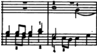
Örnek 15: (36-37. ölçüler)

Füg'ün birinci kısmında, gittikçe artan sayıda ses partisi ve artan ses düzeyi nedeniyle gerginlik yavaş yavaş yükselmektedir. Ancak bu birikim çok da yüksek bir seviyeye ulaşmaz ve 29-30. ölçülerdeki kapanış ile, neredeyse füğün başlangıcındaki kadar yumuşak bir anlatıma gelinir.