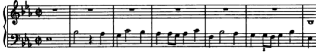
Örnek12: Füg'ün teması (1-7. ölçüler)

Bu Füg'de konunun (subject) 12 tane girişi vardır. Bunların arasında, sadece 55. ölçüde başlayan temada bir değişiklik söz konusudur. Onun dışında tüm konular tam melodik uzunluğunda verilir.