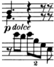
Örnek 1-a (1. ölçü)