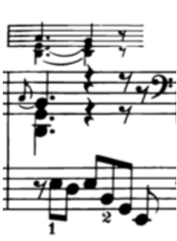
Örnek 5-a: (4. ölçü)