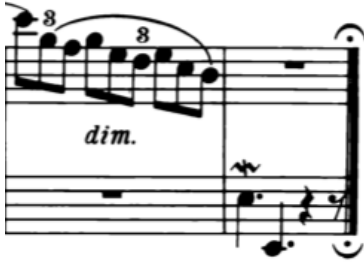
Örnek 11-a: (70-71. ölçüler)

Bu örneklerde ikili bağ altındaki notalar, aslında armoninin akorlarının açılmış halleridir. Bu sebeple de edisyonlarda bağlı yazılmaktadırlar.