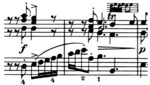
Örnek 8: (67-68. ölçüler)

9/8lik tartımdaki bu Prelüd'ün ritmik birimini sekizlikler oluşturmaktadır. Tüm Prelüd'de sadece, yukarıdaki örneklerde de verilmiş olan birkaç yerde onaltılıklara rastlarız. Örnek