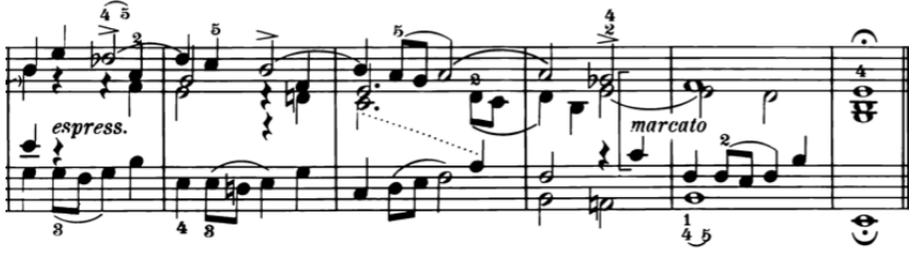
Örnek 14-e: 5. Episod (65-70. ölçüler)

Bu Füg'ün temel karakteri, özellikle çok yönlü senkoplarında, ortaya çıkması için sakin olması gereken ritmik malzemesindeki büyük çeşitlilikle belirlenir. Aynı zamanda, alla breve zaman işareti, hareketin yavaşlamasını önler ve ılımlı bir akış sağlar. Bu sakin ama akıcı stil, sıkı legato gerektiren aralıklı materyale de yansır.