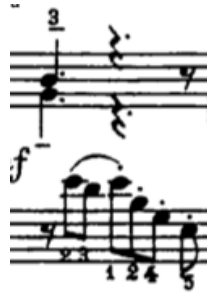
Örnek 1-b (1. ölçü)

Bu Prelüd'ün ilk ölçüsü, tüm Prelüd'de kullanılacak olan ana tematik malzemeyi vermektedir. Bu malzeme, yukarıdaki örneklerde de yer alan 1. ölçünün sol elindeki motiftir. Bu motif sağ ya da sol el, her geldiğinde aynı artikülasyonda çalınmalıdır. Bu artikülasyona karar verirken birkaç seçenek karşımıza çıkar. Çoğu edisyonda herhangi bir artikülasyon işareti yoktur ve bu bizi bir serbestliğe iter. Bu tür durumlarda ya tamamı bağlı, ya da tamamı bağımsız çalınmaktadır. Bir seçenek de Örnek 1-b'de görülen artikülasyon kombinasyonudur. Motifin arpej gibi aralıklı olan kısmı bağımsız, başındaki bitişik seslerin oluşturduğu işleme bağlı çalınabilir. Bu artikülasyon daha uygun olabilir. Çünkü motifin başındaki işlemenin asıl ortası mi bemoldür ve bu 3 işleme notasının daha iddiasız ve işleme karakterinde olması için bağlı çalınması ve ardından gelen aralıklı notaların daha artiküle duyulabilmesi için bağımsız çalınması tercih edilebilir.