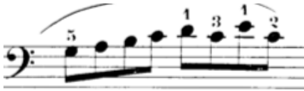
Sol el, 10. ölçü

Bu örnekteki sol el parmak numaralarına bakacak olursak, karışıklığı ile öğrenciyi zorlayabilecek bir parmak dizilişi görürüz. Örneğin ikinci yarısında re-do-mi-do nota grubuna önerilen 1-3-1-2 parmağı, ilk bakışta anlamsız bir karışık dizilişi gibi görülebilir. Grubun birinci do notasına 2. parmak kullanılması hem daha el altında olması sebebi ile kolay, hem de karışıklıktan daha uzaktır ve kullanılabilir. Ancak bu do notasına 3. parmak