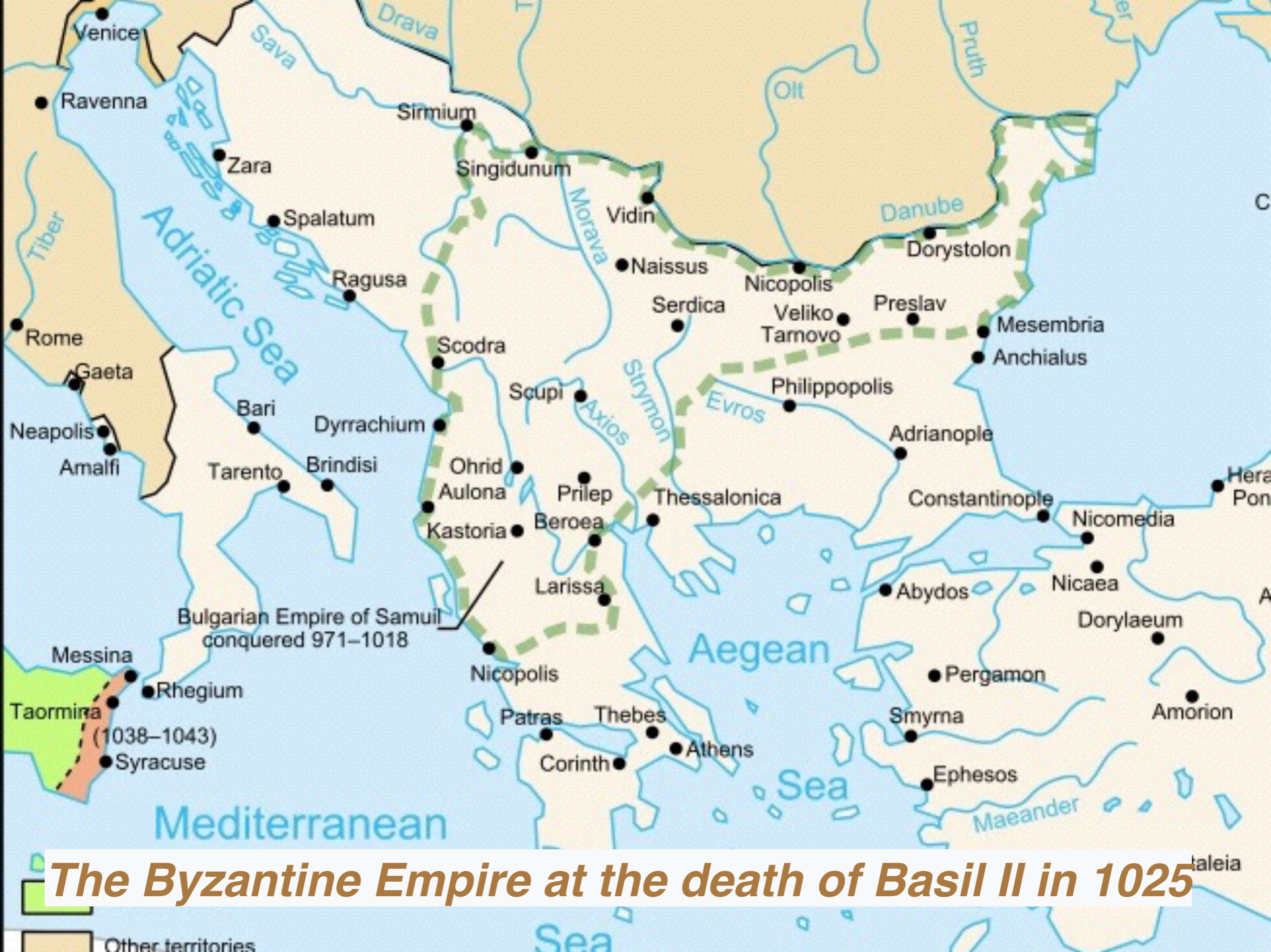
The Byzantine Empire at the death of Basil II in 1025