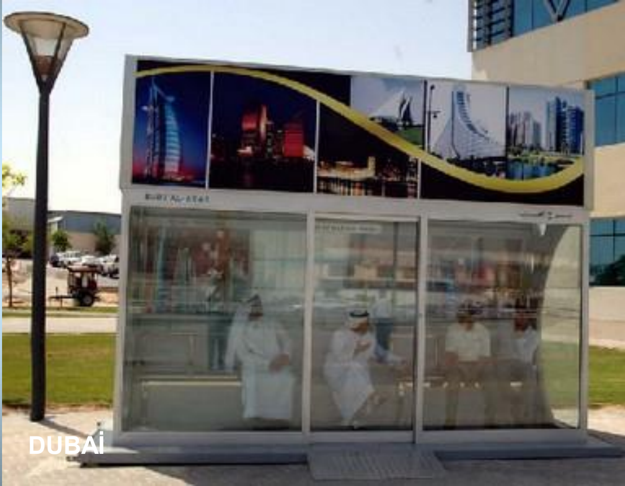
Klimalı otobüs durađı