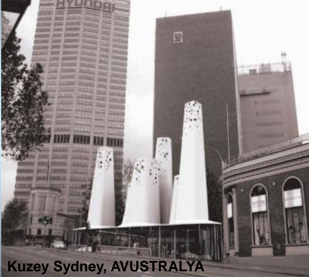
Kuzey Sydney, AVUSTRALYA