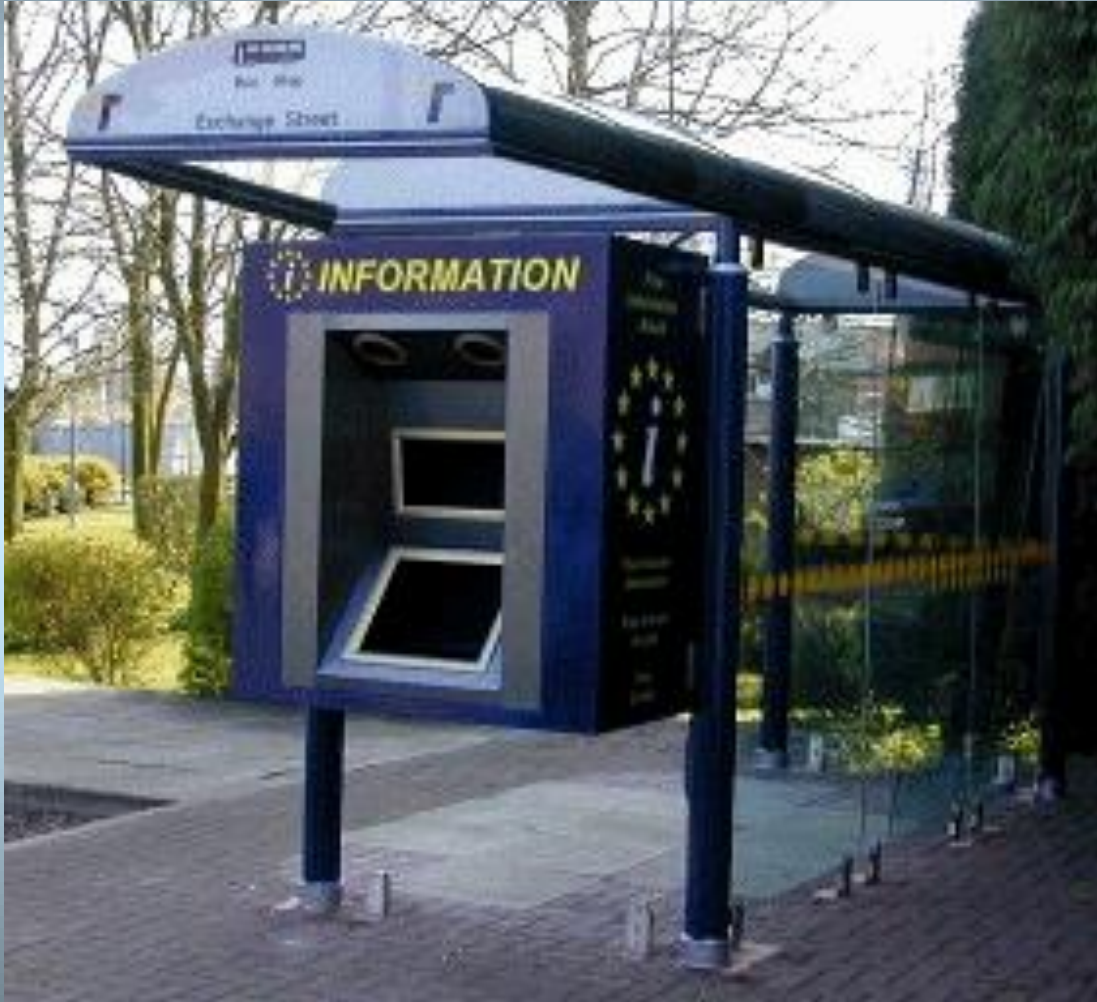
Dokunmatik otobüs sığınacağı