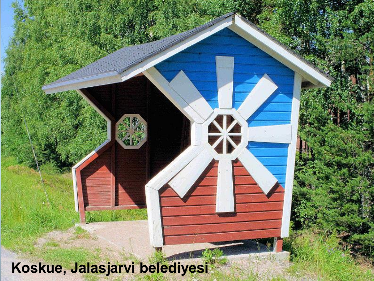
Koskue, Jalasjarvi belediyesi

Rüzgardan korunmaya karşı yapılmış bu tahta bir otobüs durağı sığınağı, bir rüzgar değirmeni temasıyla dekore edildi. Rüzgar değirmenleri, Jalasjarvi'nin simgeleridir