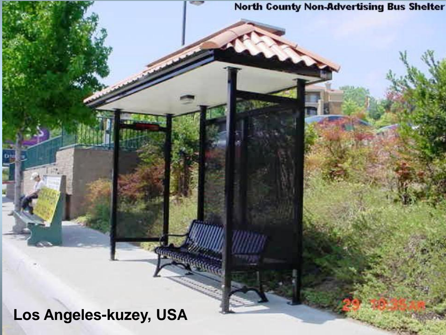
Los Angeles-kuzey, USA