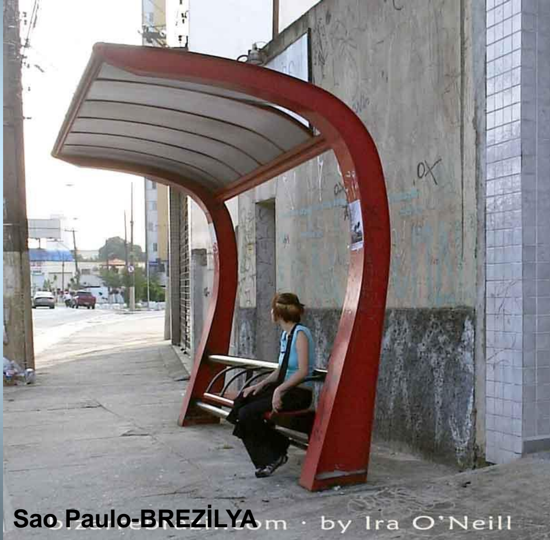
Sao Paulo-BREZİLYA