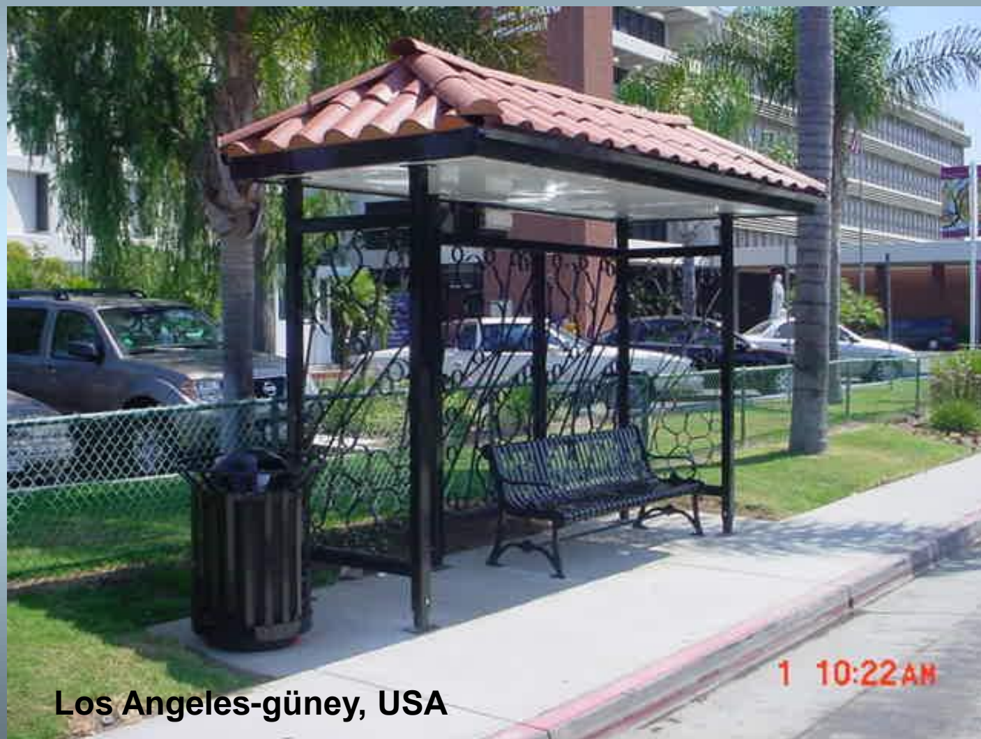
Los Angeles-güney, USA