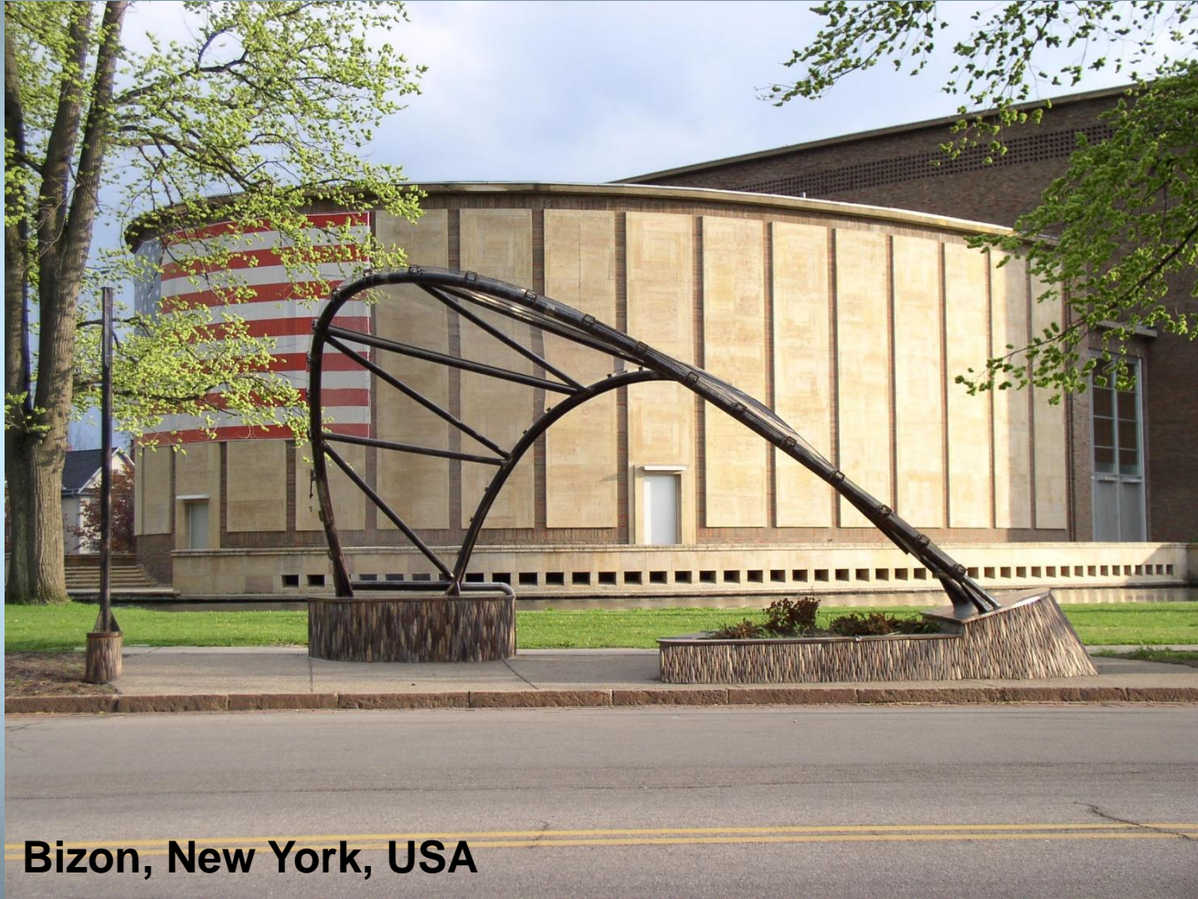
Bizon, New York, USA

Buffalo üniversitesi öğrencilerinin ödül almış otobüs durağı tasarımıdır.