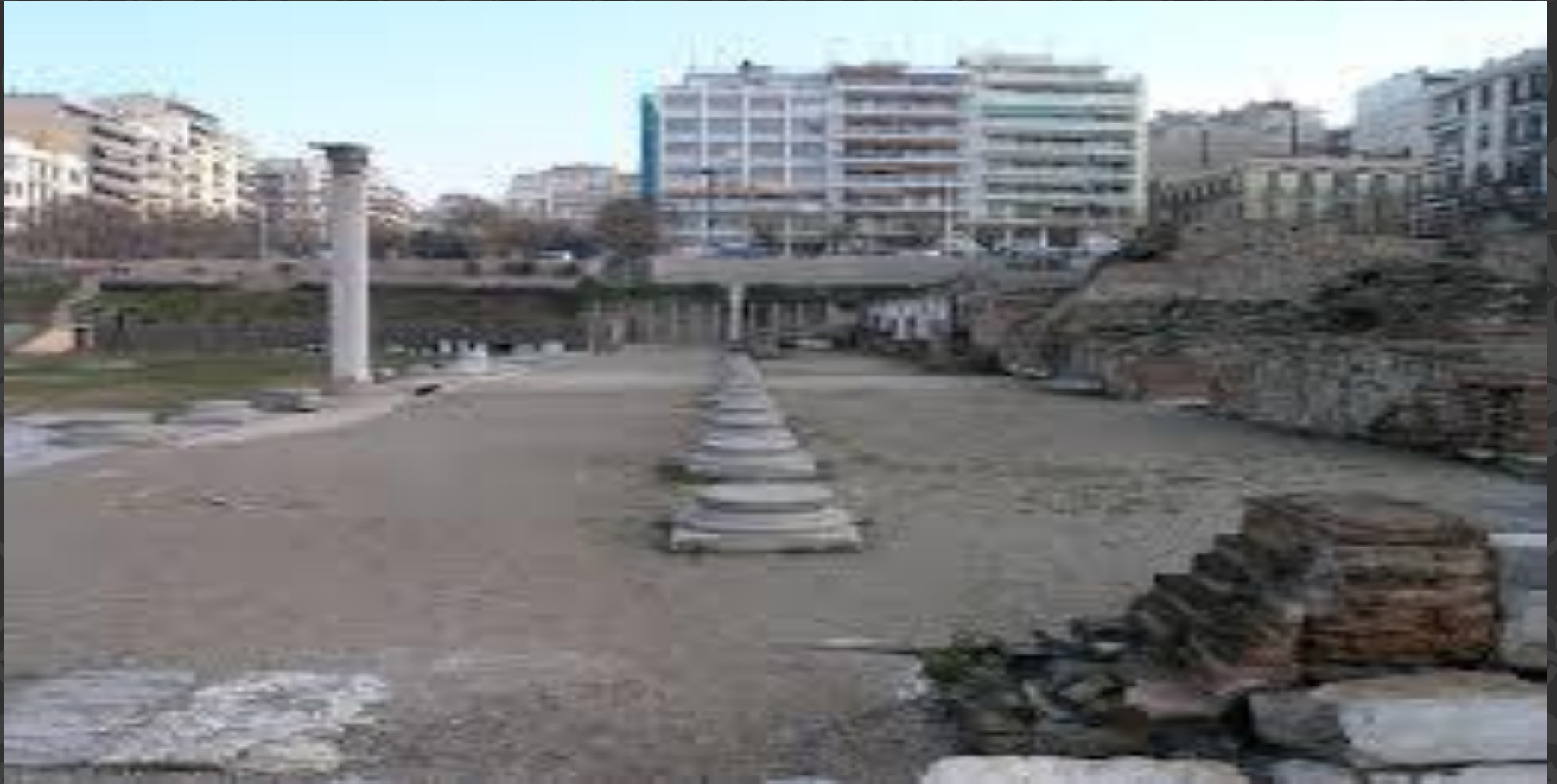
Tarihi Selanik agorası

İlk agoralar Őekil olarak son derece basit olup, bir krs ve oturma yerleri bulunan mekanlar coŐkulu konuŐmalara sahne olmaktaydı. Dini iŐerikli Őenlikler ve tiyatro gsterileri de ilk zamanlar agorada dzenleniyordu(5).