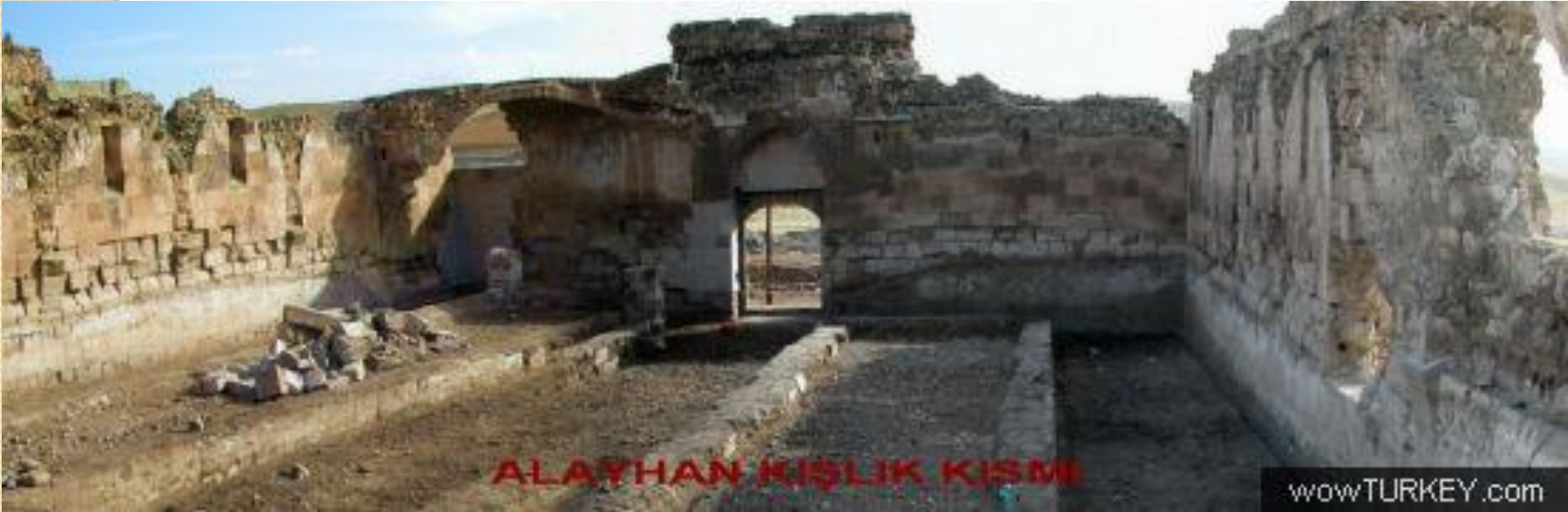
ALAYHAN KİŞLİK KİSİMİ