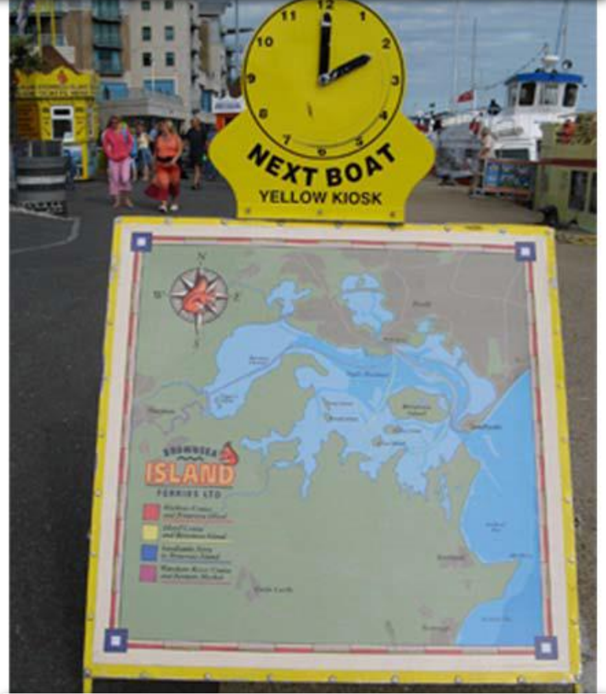
Bot sefer saatlerini gösteren bilgi panosu