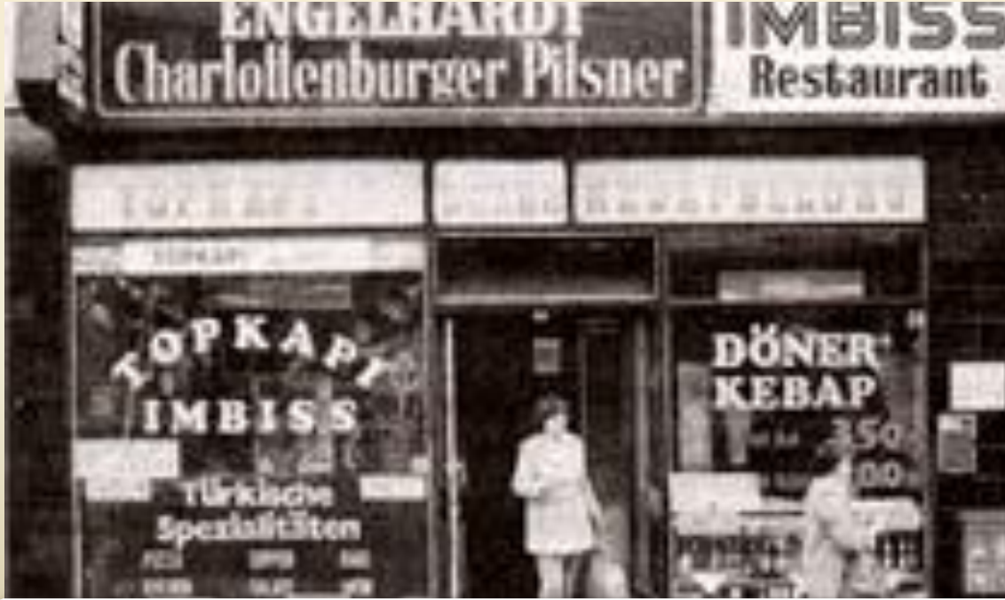
Berlin'de bir Türk Dükkanı

Nüfus yapısı çok hızlı deęişim gösteren İstanbul gibi kentlerde ise kültürel özellikler bu noktada daha da önem taşımaktadır. Çünkü hızlı deęişen nüfus yapısı hızlı deęişen kültürel yapıdaki deęişimi beraberinde getirir ve bu noktada da kentsel kimlik üzerindeki bu etki kentler tarafından hızlı cevaplar üretmeyi gerekli kılarken kentlerin kaos ortamına bürünmesine neden olur. Doğal süreçte yaşanan kültürel deęişimler aynı sürece kentlerin cevap verebilmesini sağlarken, hızlı deęişim kentlerin çözümsüz kalmasına neden olmaktadır