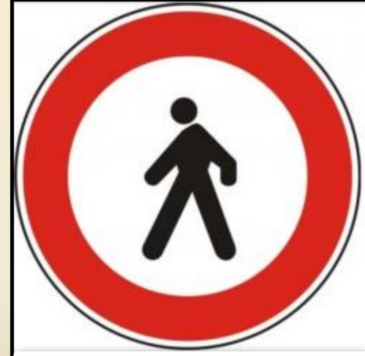
Türkiye'de kullanılan yaya geçidi trafik işareti