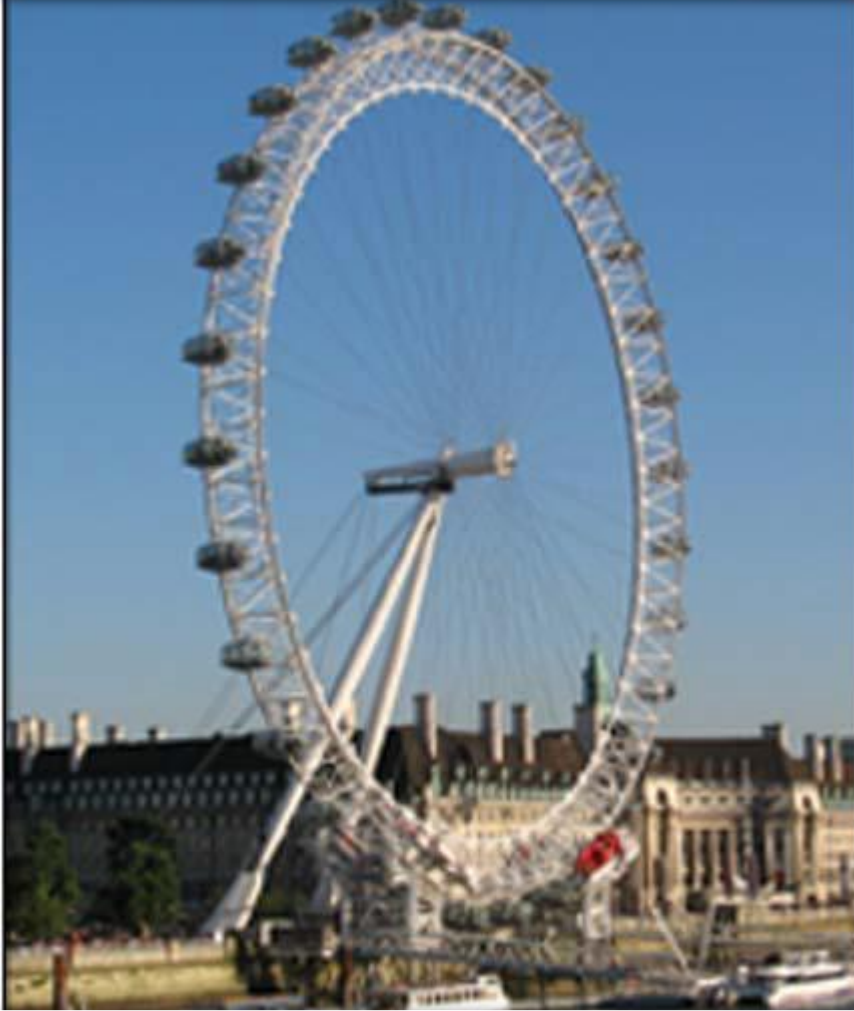
Kentin simgesi haline gelmiş 'London Eye'