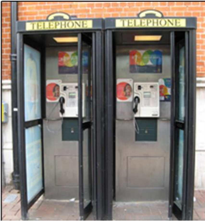
Portsmouth'da telefon kabinleri