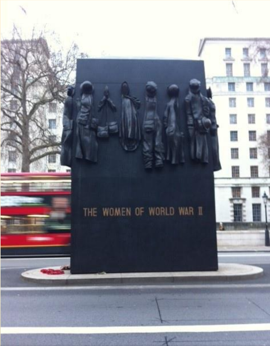
Kentin simgesi haline gelmiş 1. Dünya Savaşı Anıtı