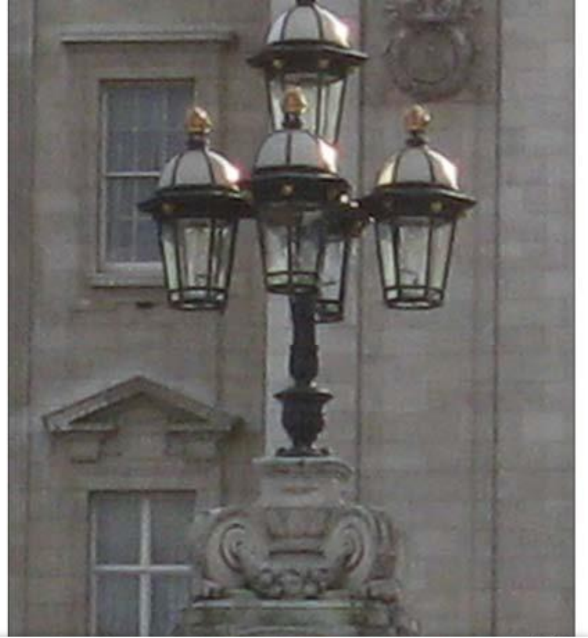
İngiltere'den aydınlatma elemanları