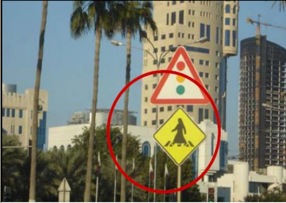
Orta doğu ülkesi Katar'ın Başkenti Doha'dan yaya geçidi trafik işareti

Arap ülkesi Katar'da yerel halktan kadınlar ancak çarşafıyla sokağa çıkabilmekteler. Bu idari, kültürel ve dini yapıdan kaynaklanan kent yaşantısının, kentin sokaklarına, mobilyalarına yansması beklenen bir sonuçtur. Kentte trafik işaretinin üzerinde bulunan kadın figürü çarşafı ve başı örtülü bir şekilde sembolize edilmektedir.