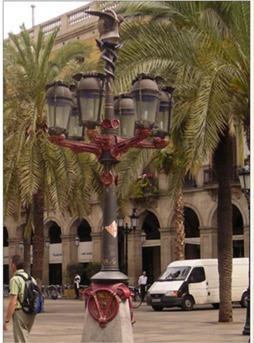
Gaudi'nin eseri aydınlatma elemanı/Plaça Reial