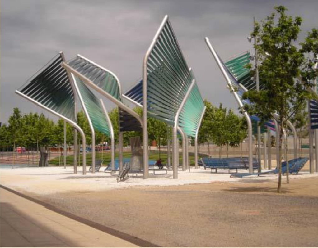
Proje alanlarında yer alan oturma elemanları

Dünya sisteminde 70'ler boyunca ve 80'lerin başında yaşanan dönüşümlerden bütün sanayi kentleri gibi Barcelona da etkilenerek ciddi bir ekonomik kriz içine girmiştir. 1988 yılında çözüm olarak; kamusal mekânları yenilemeye öncelik verilerek, Tarihi Kent Merkezinin (Ciutat Vella) rehabilitasyonunu gerçekleştirilmiştir.