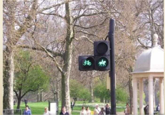
Trafik ışıkları atlı iletişimi de düzenliyor