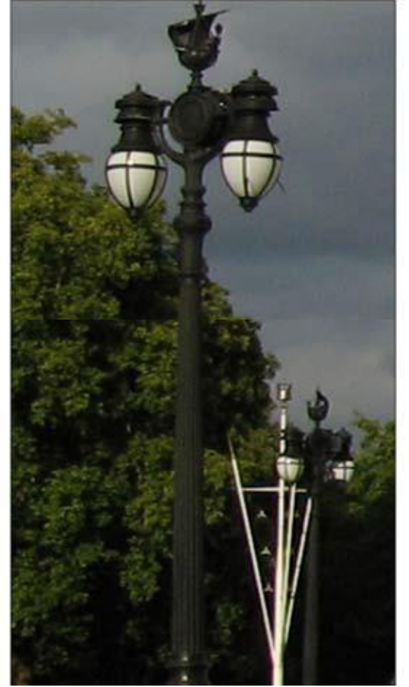
İngiltere'den aydınlatma elemanları