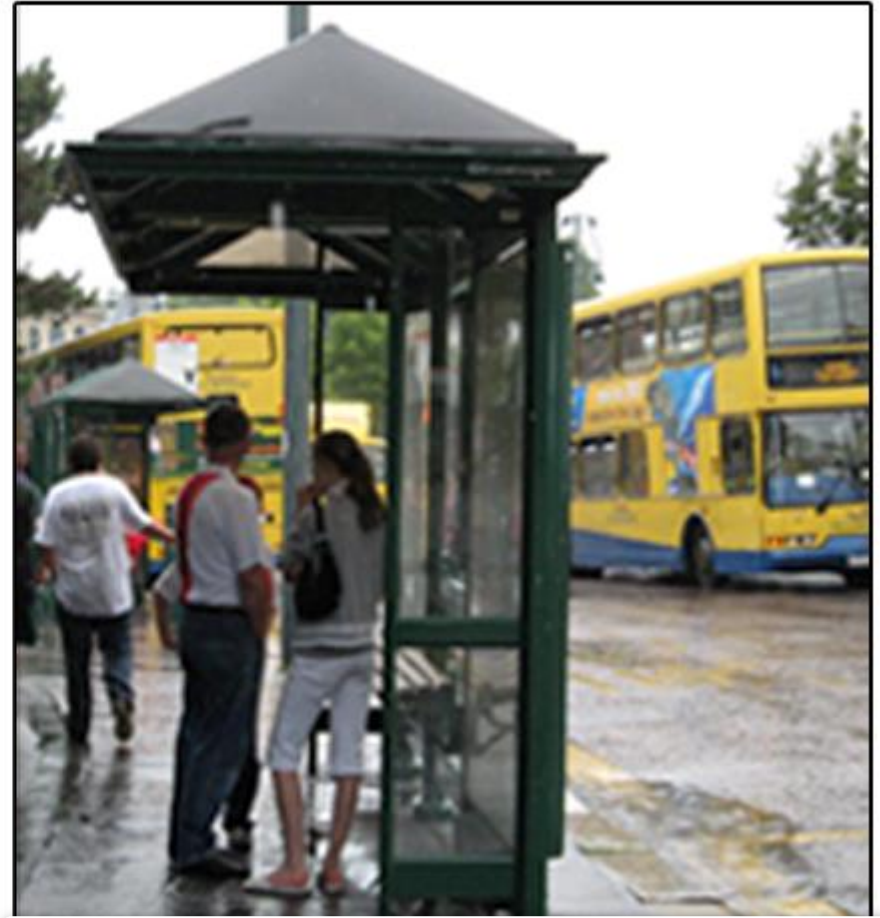
Portsmouth'da otobüs durakları

Portsmouth'da, Londra'nın sembolü haline gelmiş kırmızı telefon kabinlerinin yanı sıra resimde yer alan telefon kabinlerine de rastlamak mümkündür. Sürekli yağmurlu havanın hakim olduğu kentte, otobüs durakları yola ters olarak konumlandırılmış ve böylece duraklardaki yayaların, araçların sıçratacakları yağmur sularından korunmaları sağlanmıştır.