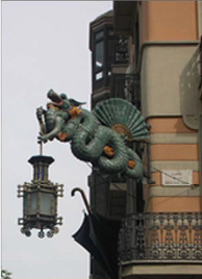
Tarihi kent merkezinde yer alan aydınlatma elemanı