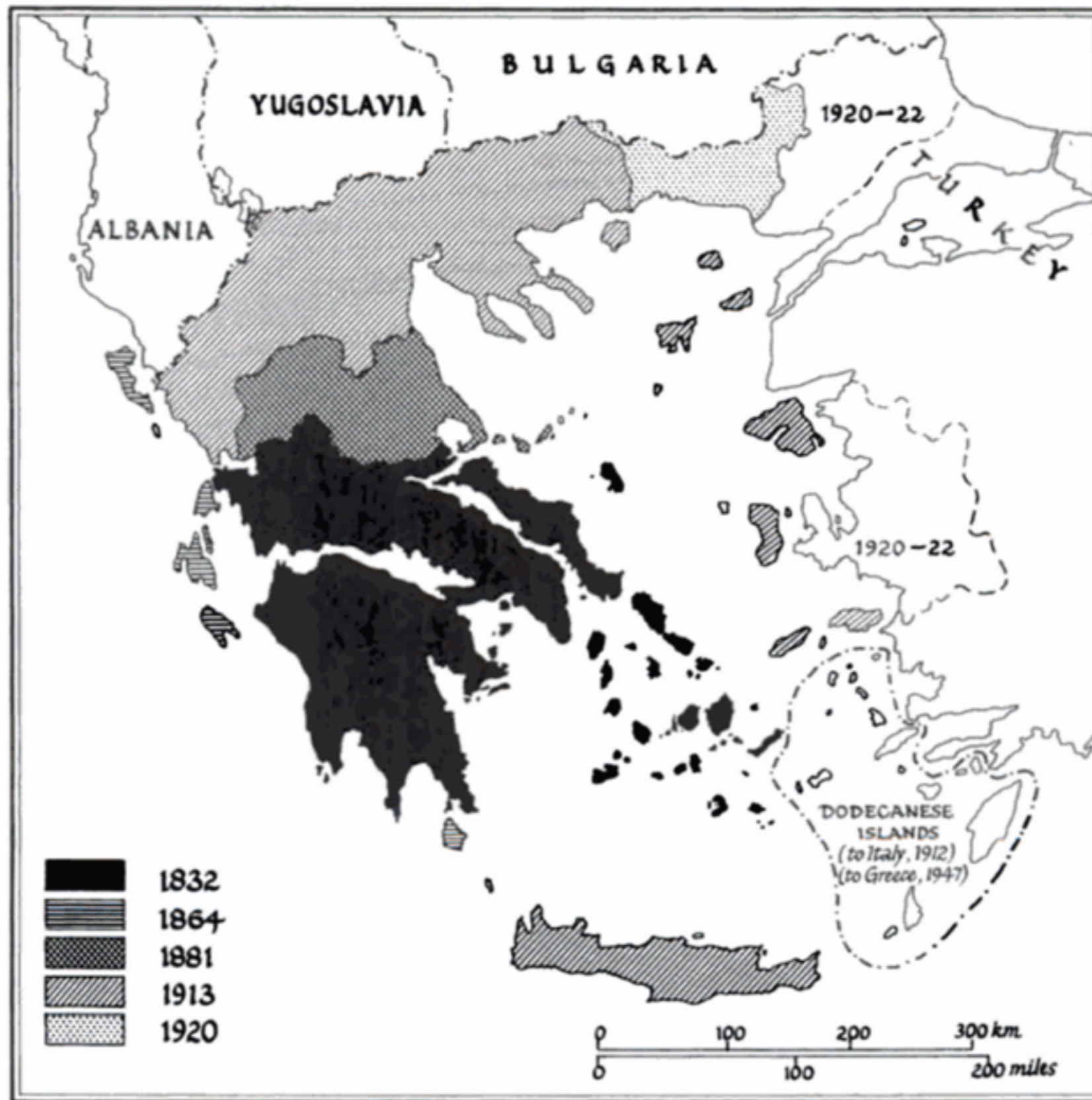
Map 2 The expansion of the Greek state, 1832-1947