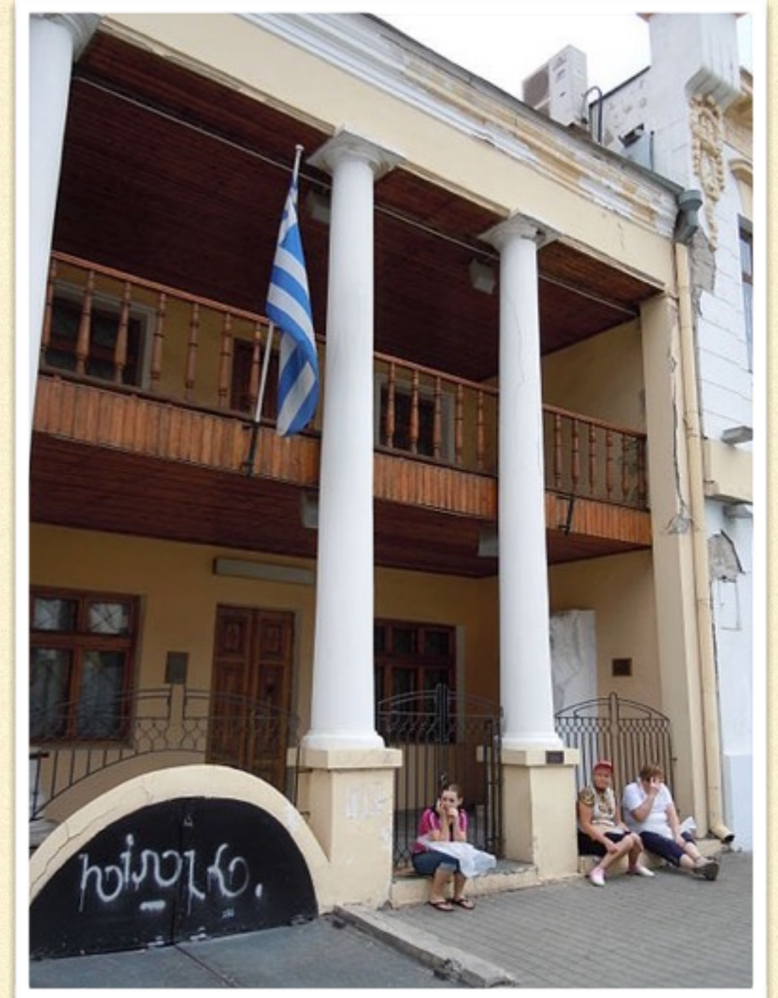
Odessa'da Yunan Meydanı'nda Filiki Eteria Evi