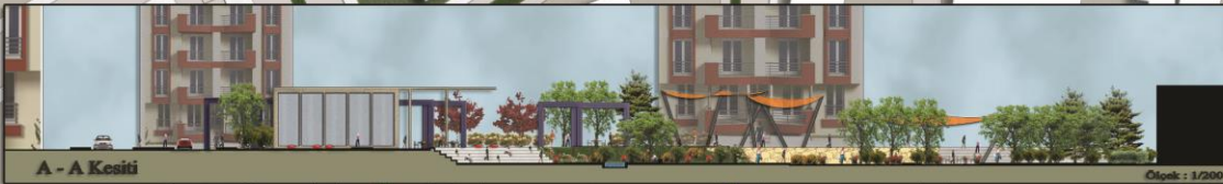
A - A Kesiti