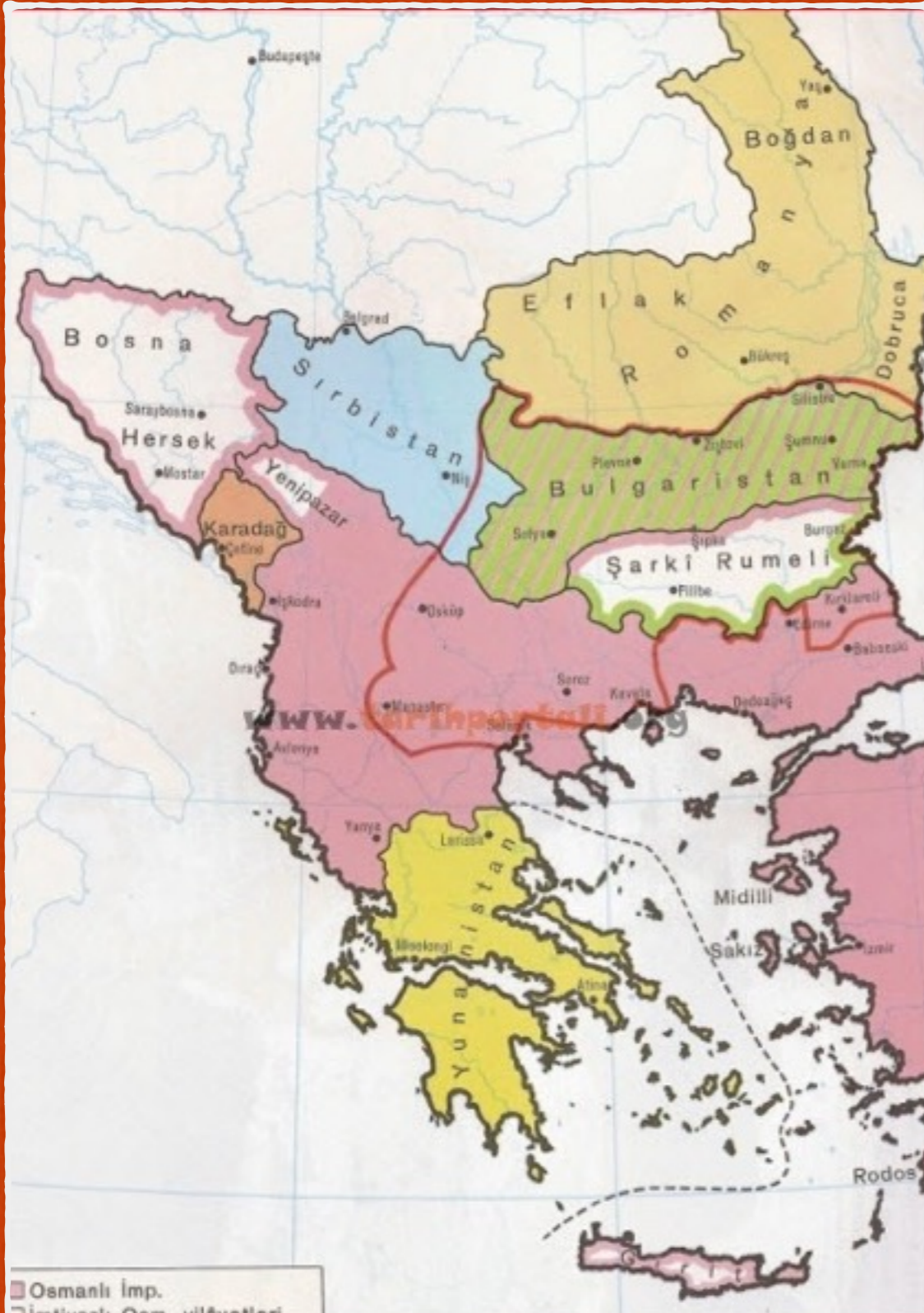
Berlin Antlaşması ve buna bağlı 1878-1881 arasındaki antlaşmalarla tespit edilen Balkan Devletleri sınırları