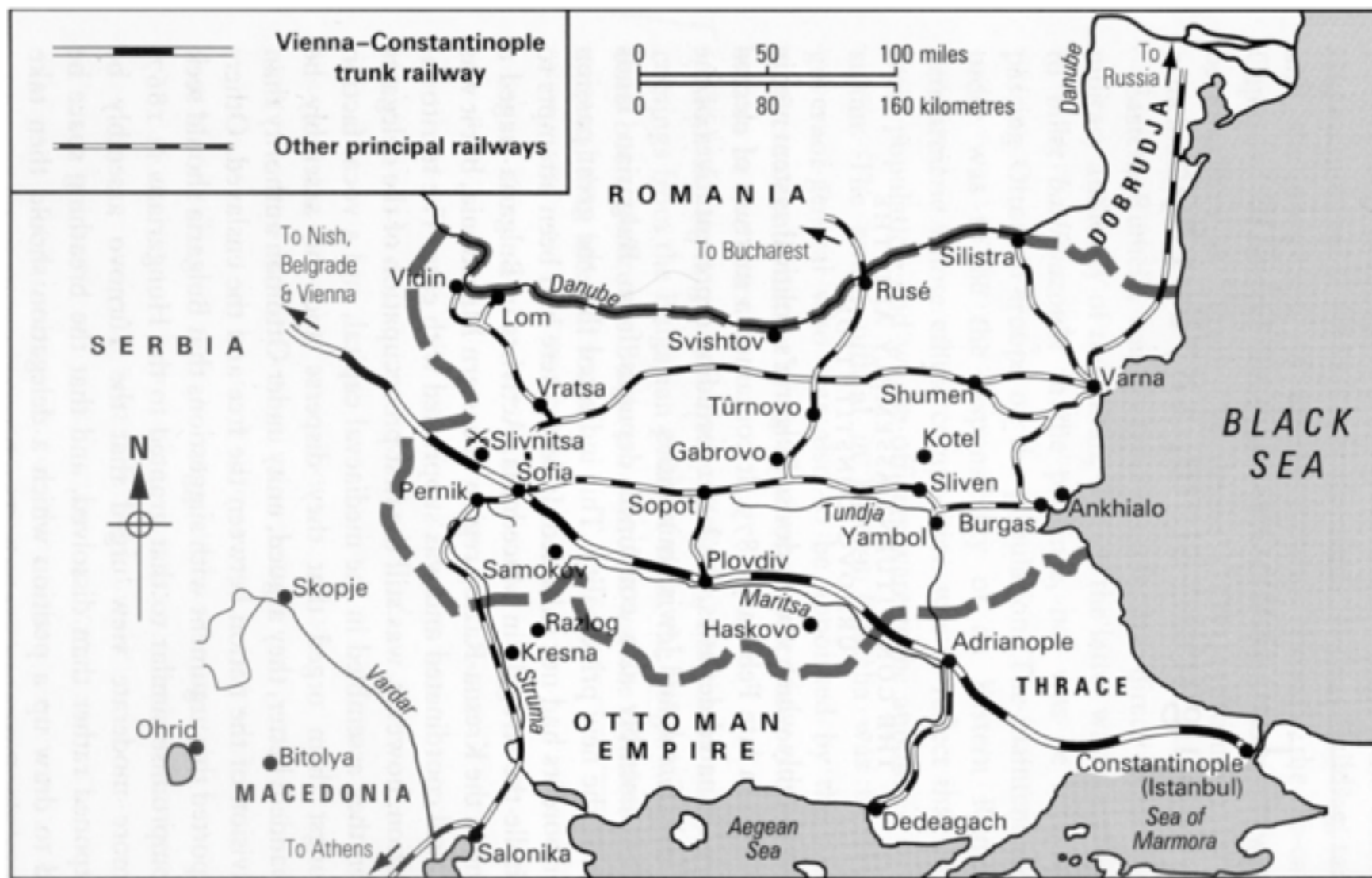
Figure 23: A detailed map of Bulgaria, including the Vienna-Sofia-Constantinople railway. 423