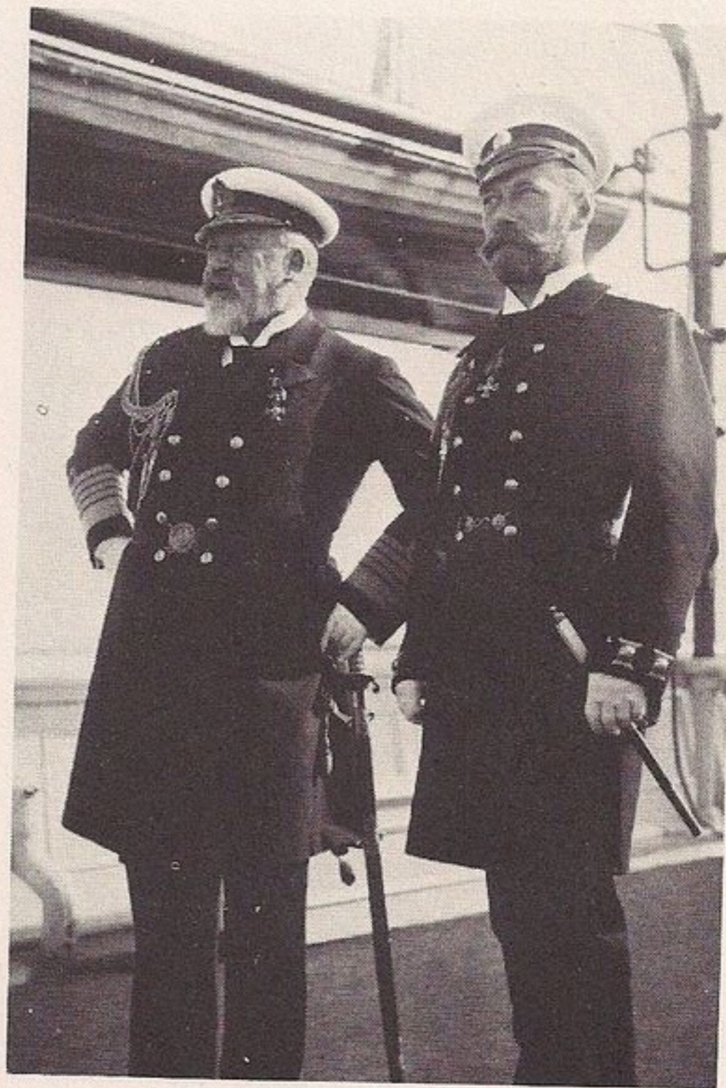
King Edward VII and Tsar Nicholas II at Reval (Reproduced by gracious permission of Her Majesty Queen Elizabeth II).