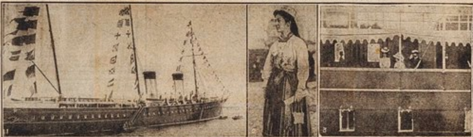
All the ships in the harbour at Reval were lavishly decorated for the arrival of the King and the Tsar, and the scene presented was an extremely brilliant one. As soon as the royal yacht steamed into its position the Tsar proceeded on board to welcome the King and Queen