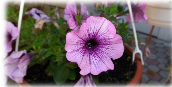
Kaynak: Anonim, 2019