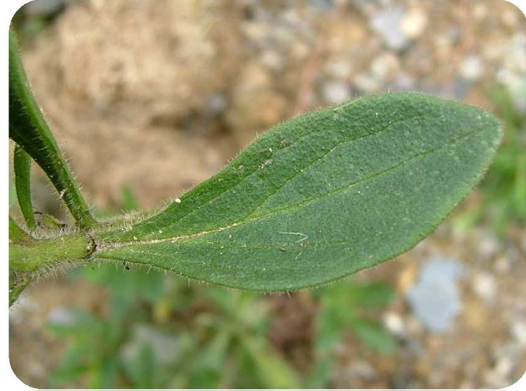
Petunia hybrida L.