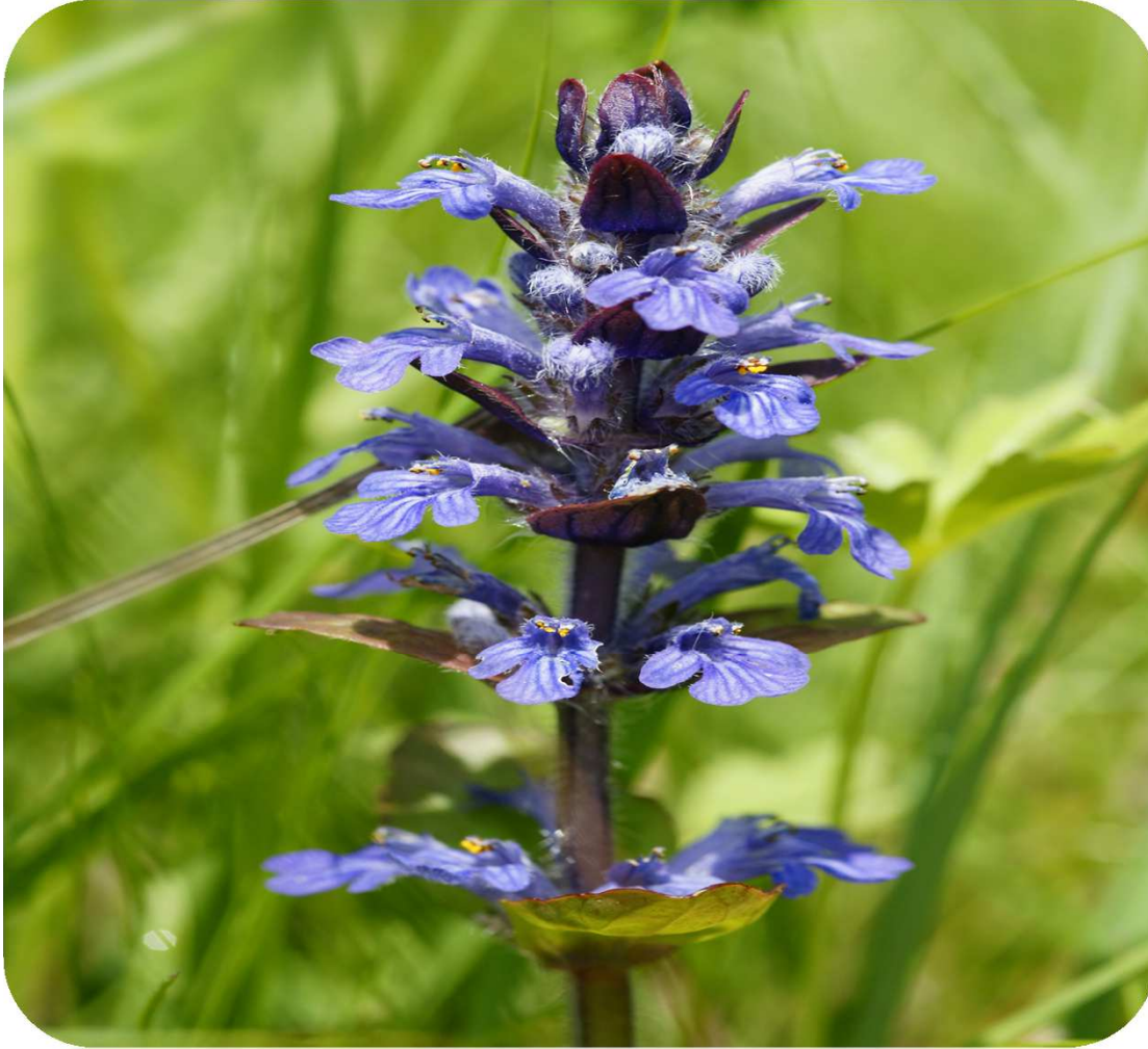
Ajuga Reptans L.