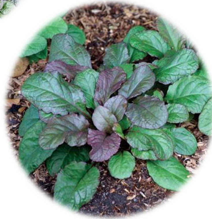
Dağ Mayası Otu