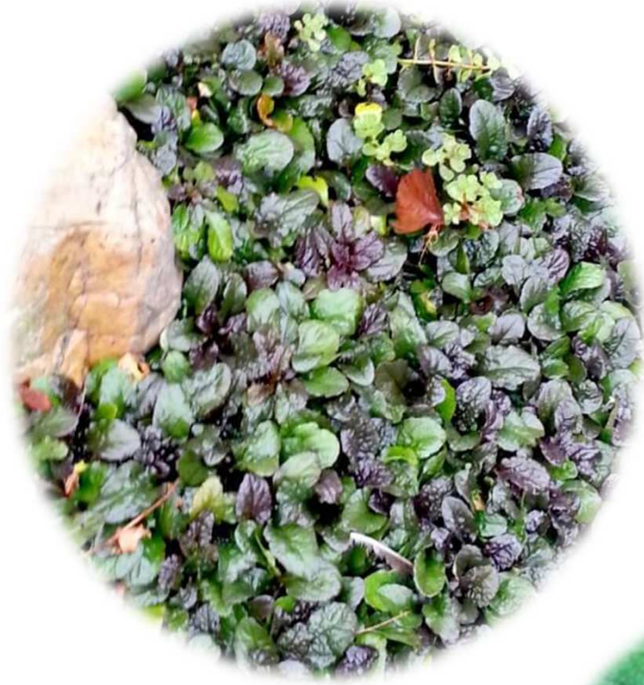
Ajuga Reptans L.