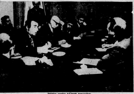
Dalokay yapılan geçici komisyon.