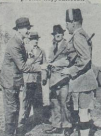
Filistinde yeni askerî tedbirler alan general Dil Hayfada

Örji idare ilân edilirse on arab prensi nefyedilecek