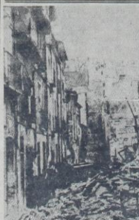
Alkazarın bombardımandan sonraki hali ve Toledo'dan bir sokak (Yazır 3. üncü sayfa)