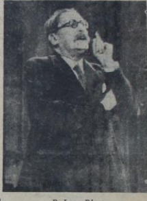
B. Leon Blum