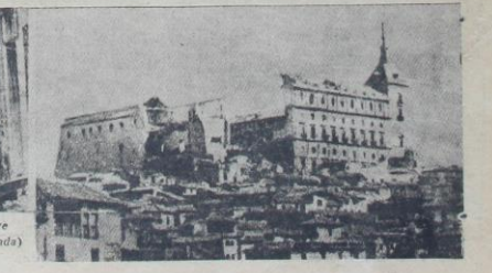
Alkazarın bombardımandan sonraki hali ve Toledo'dan bir sokak (Yazır 3. üncü sayfa)