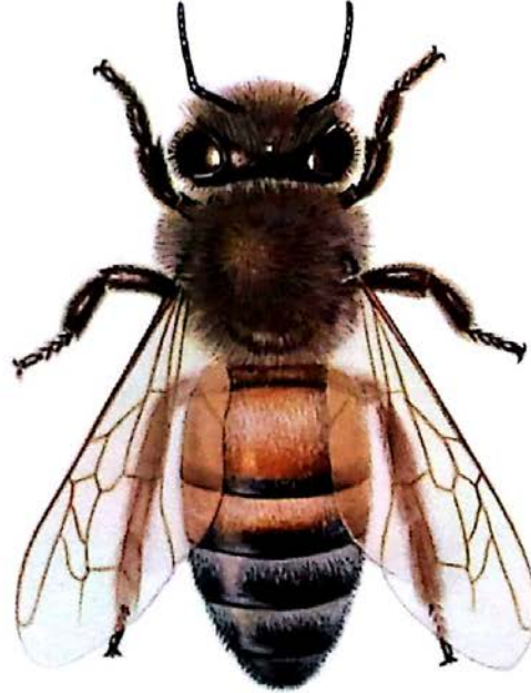
ITALIAN BEE Apis mellifera ligustica