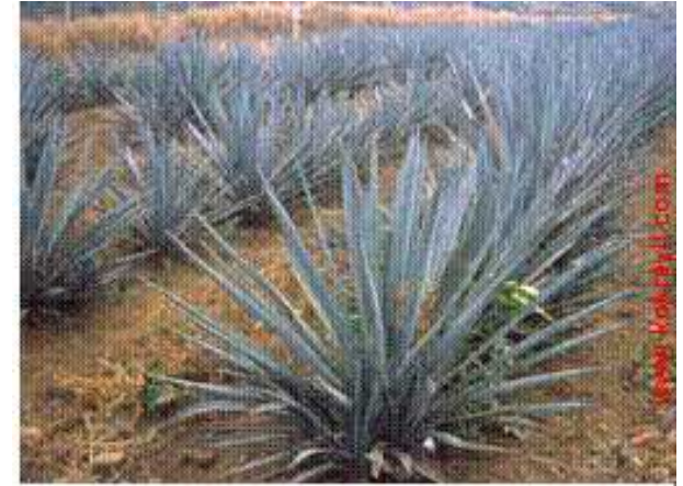
Mavi agave tarlaları

Dünyadaki kaktüslerin yaklaşık %60 Meksika da bulunmaktadır. Birçok farklı kaktüs çeşidini barındıran Meksika'da, yüksek alkollü bir içki olan Tekila, blue agave adlı bir tür kaktüsten yapılmaktadır.