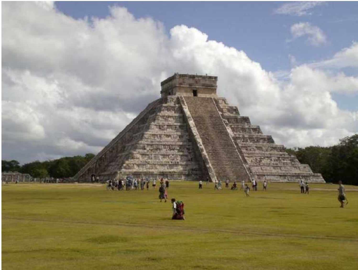
Chichen itza piramidi