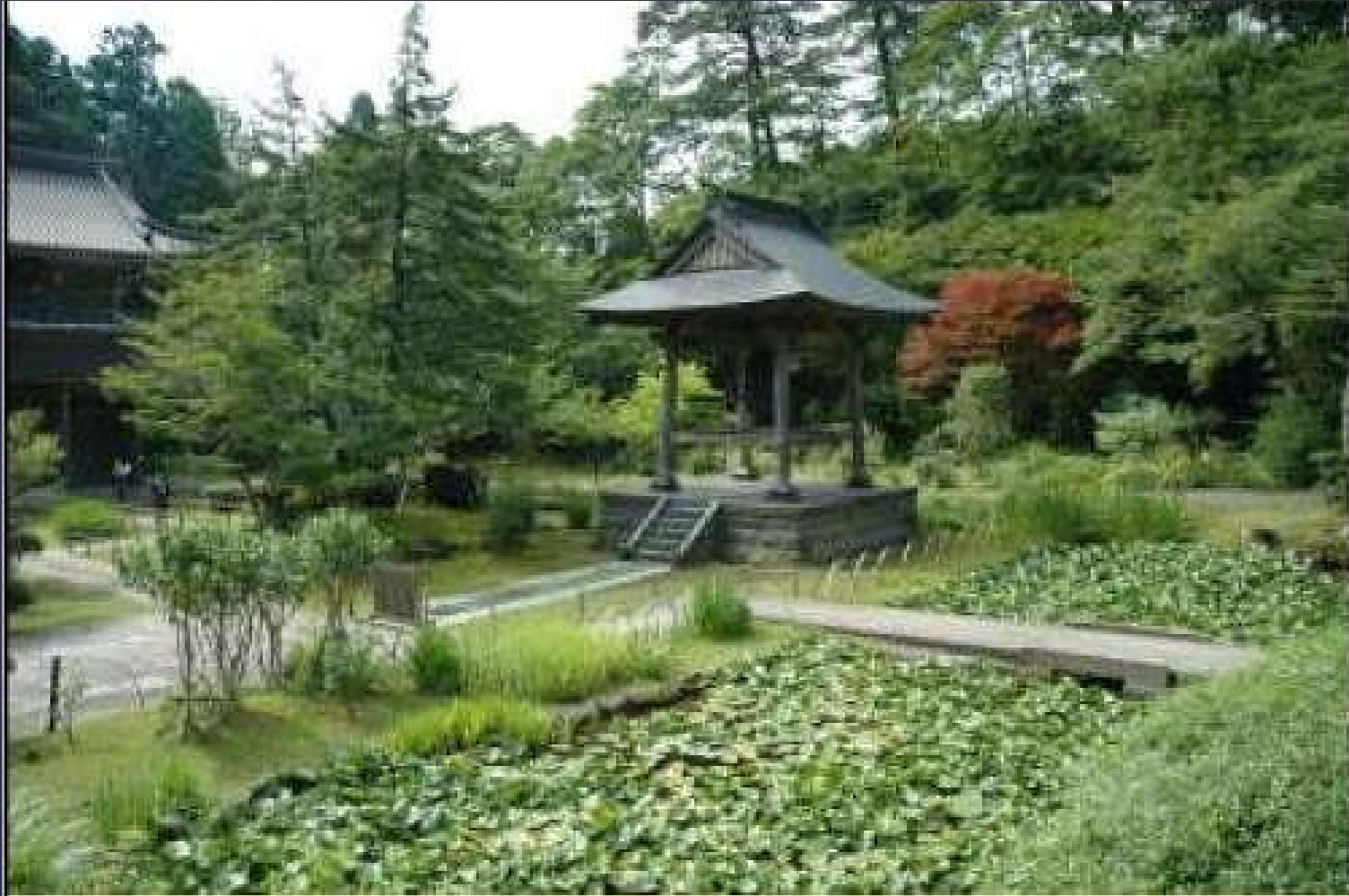
Rinsenji Bahçesi (Japonya)