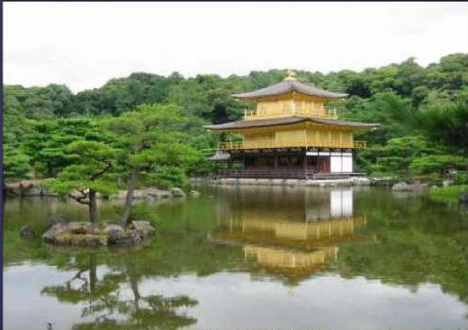
Golden Pavilion/ Kinkakuji (Japonya)