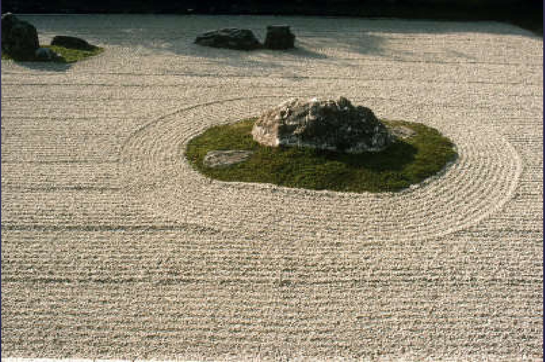
Kuru tař bahesi