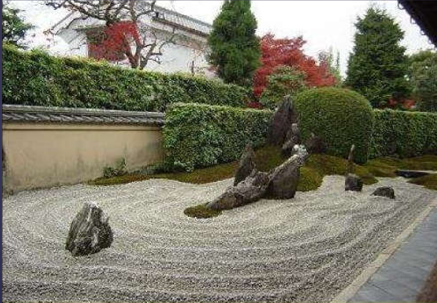
Zuihoin Bahçesi (Japonya)