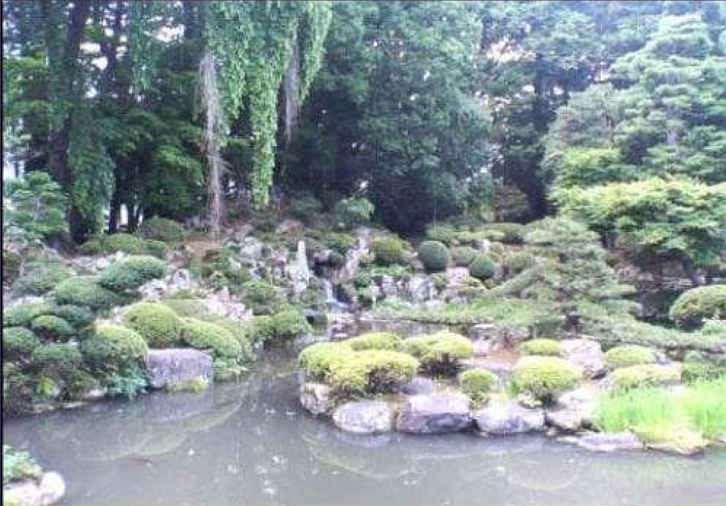
Erinji Bahçesi (Japonya)