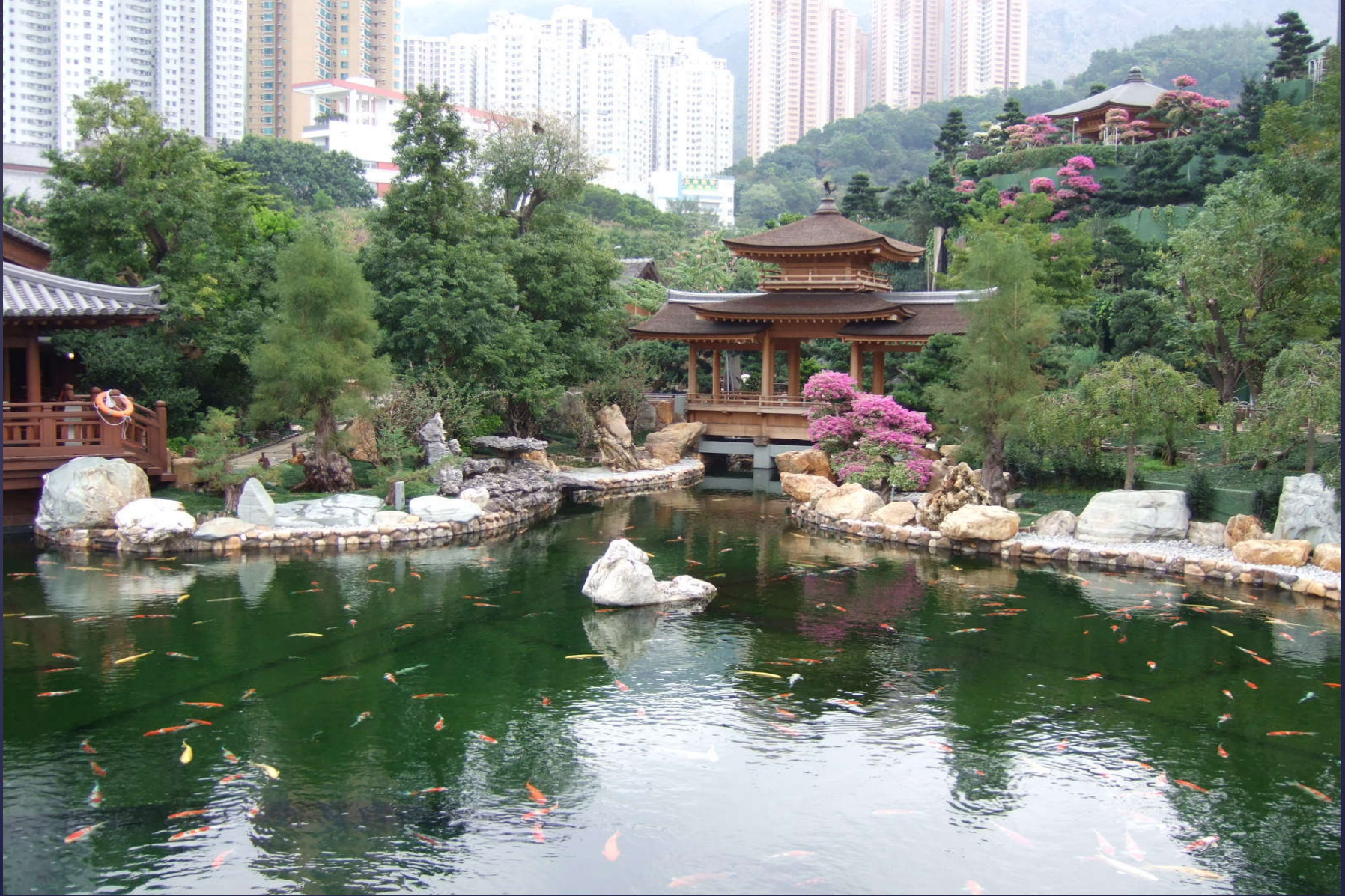
Japon Su Bahçesi