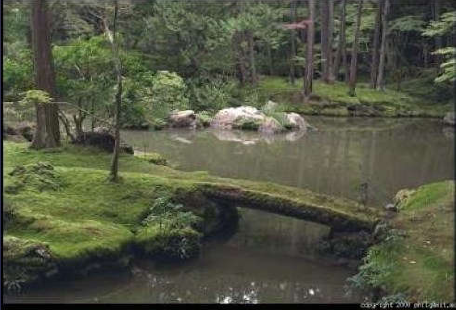
Saihoji Bahçesi (Japonya)