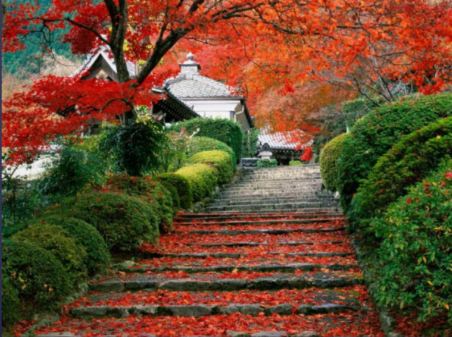
Şair ruhlu kimseler bahçesi