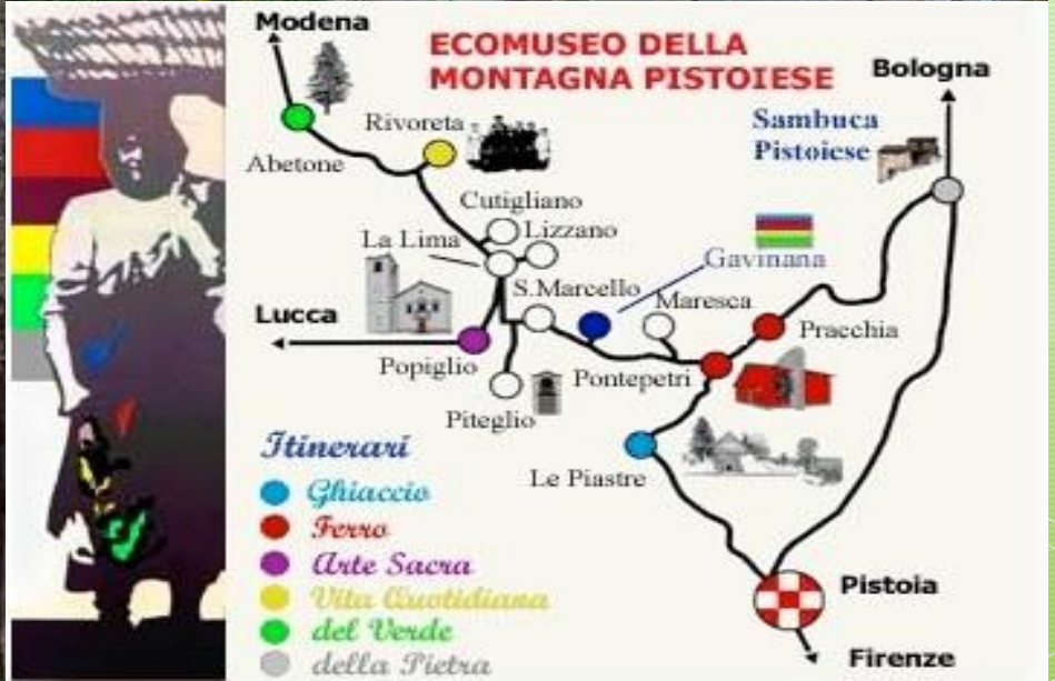
Ecomuseum Della Montagna Pistoiese, Italya