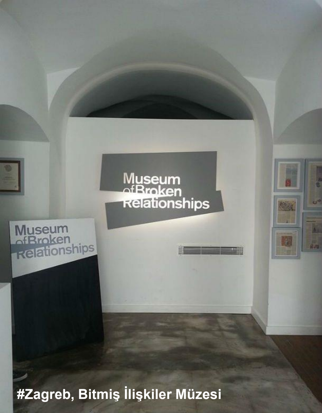
#Zagreb, Bitmiş İlişkiler Müzesi