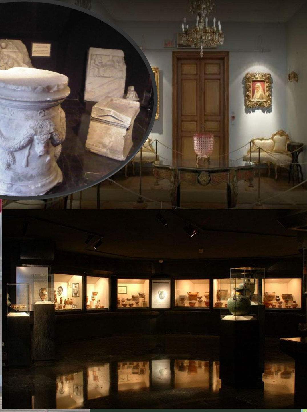
Sadberk Hanım Müzesi, İstanbul