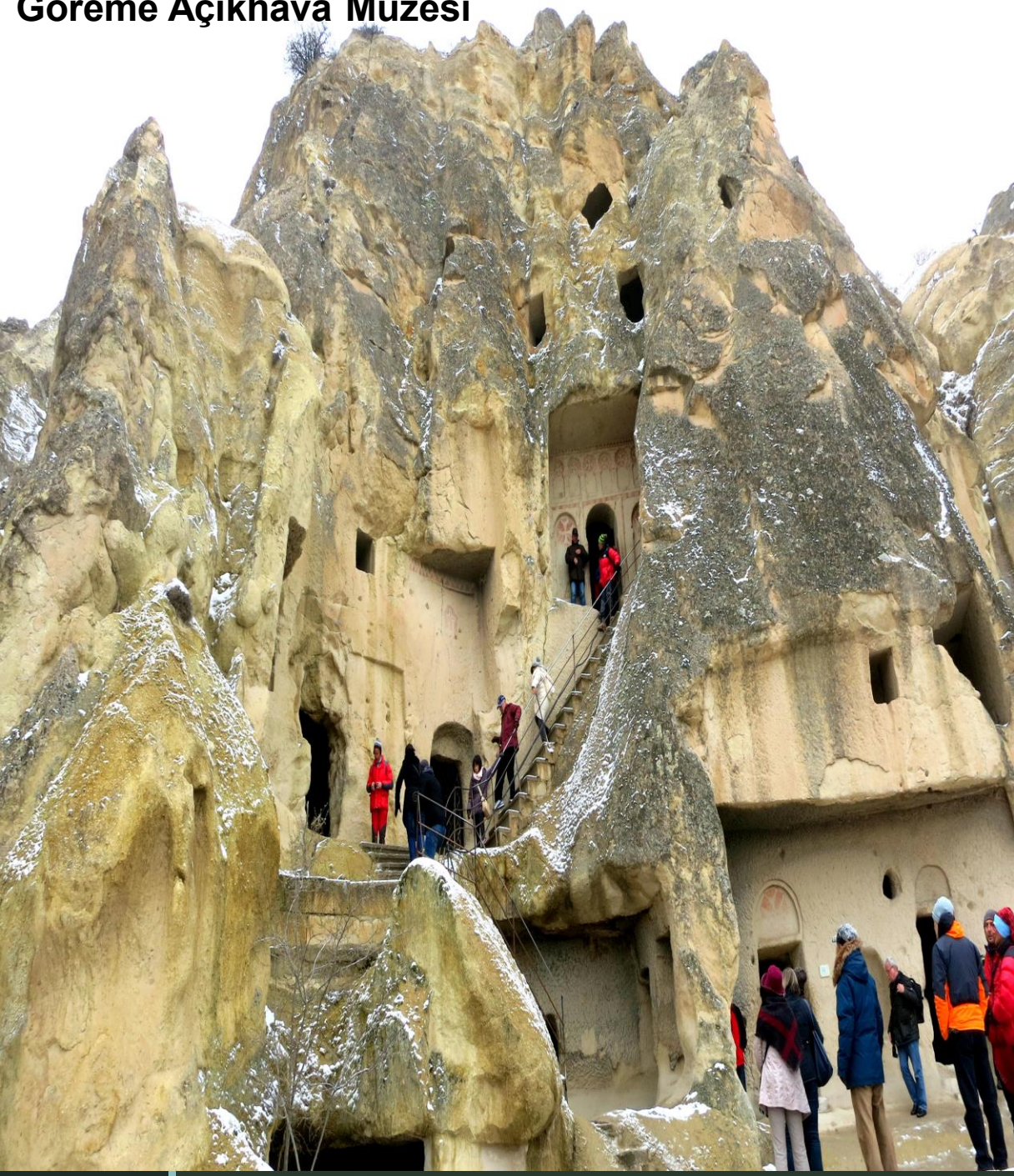
Göreme Açık hava Müzesi