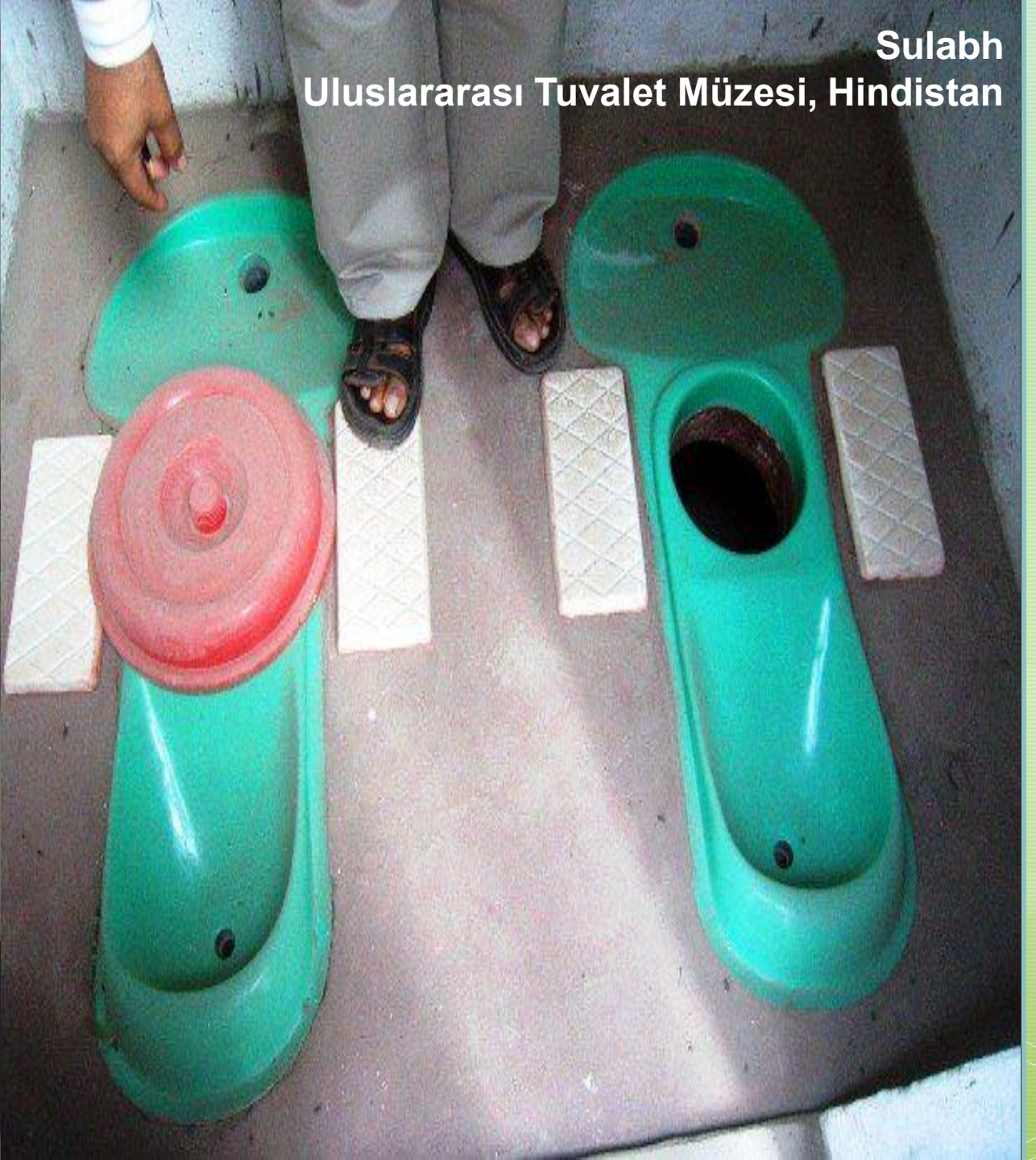
Sulabh Uluslararası Tuvalet Müzesi, Hindistan