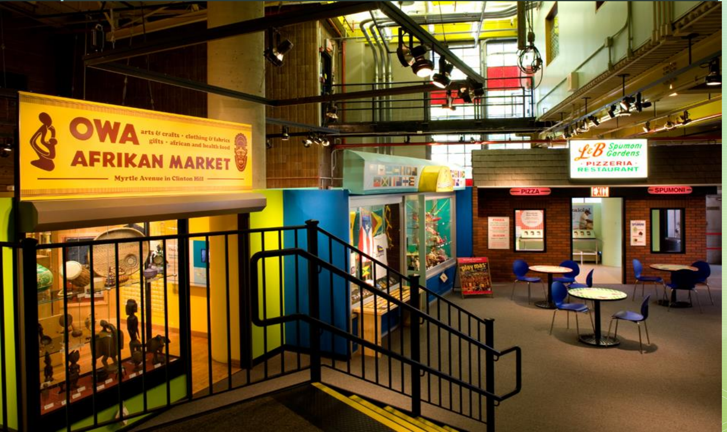
Brooklyn Çocuk Müzesi, ABD