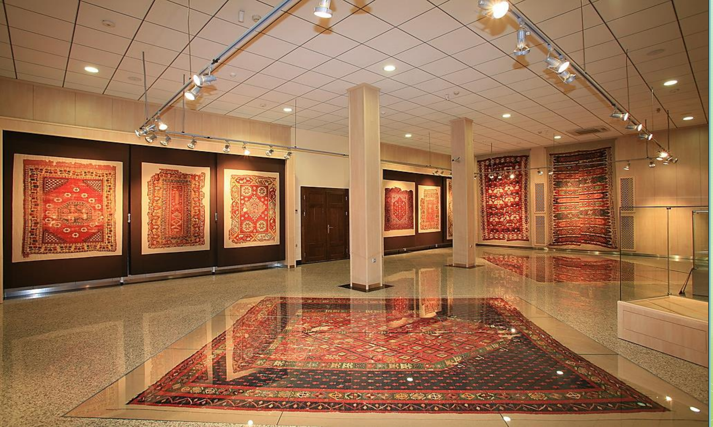
Vakıf Eserleri Müzesi, Ankara