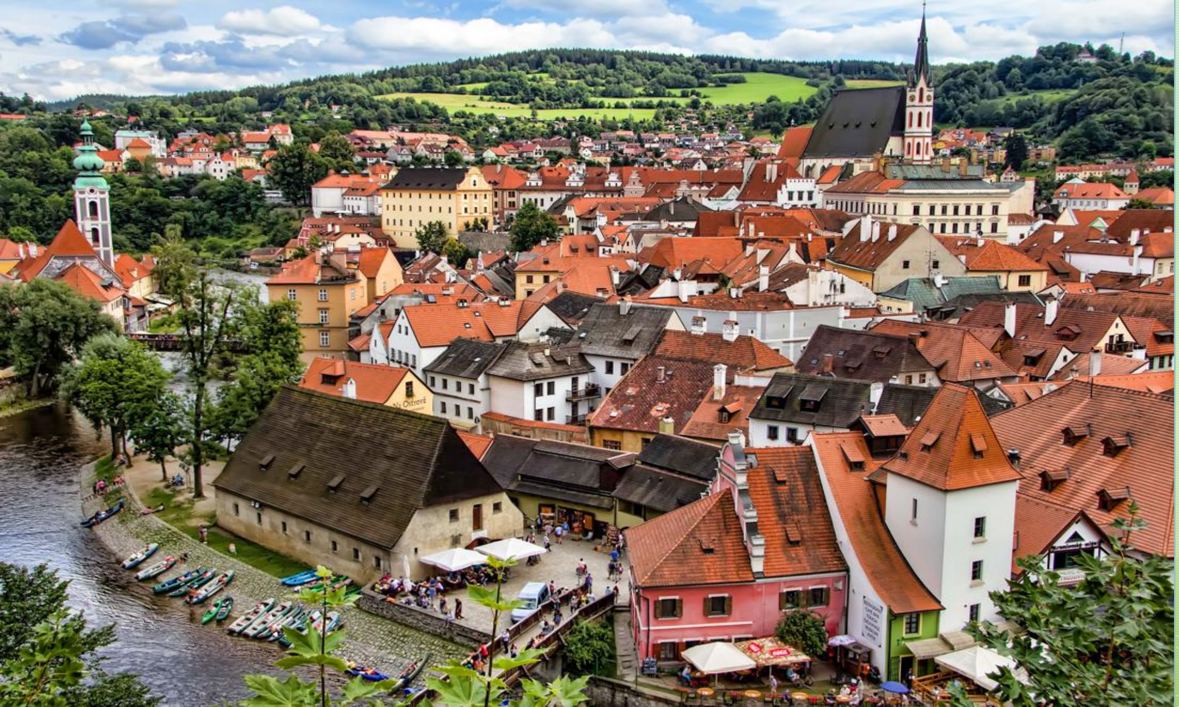
Cesky Krimlov Bölge Müzesi, Çek Cumhuriyeti