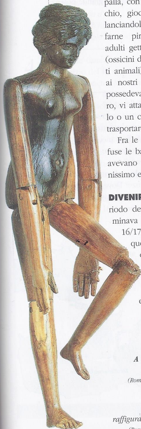
A sinistra, una bambola romana snodabile.

LE NOZZE La vigilia delle nozze la ragazza deponiva l'abito da fanciulla ed offriva alle divinità domestiche i suoi giocattoli. Per il matrimonio vestiva una tunica , una sorta di lunga camicia, trattenuta in vita da una fascia che doveva essere annodata in modo particolare contro il malocchio; sul capo portava un velo rosso. Una delle più antiche cerimonie nuziali prevedeva che i due sposi gustassero insieme una focaccia di farro , invocando le divinità protettrici del matrimonio. Dopo il pranzo di nozze, la sposa era condotta in corteo nella nuova casa. Qui giunta, lo sposo la prendeva in braccio e le faceva varcare la soglia: la donna infatti entrava da straniera nella casa del marito e se avesse toccato la soglia – o peggio ancora vi avesse inciampato – avrebbe suscitato l'ostilità degli dèi familiari.