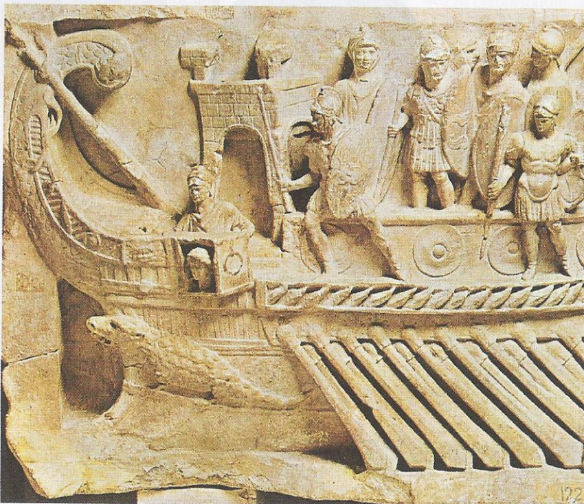
Nave da guerra romana.

I Romani non avevano esperienza marinara, ma cercarono di adattarsi a nuove tecniche di combattimento. In breve tempo costruirono una flotta di 100 navi, munite di passerelle ribaltabili, dette corvi , con cui era possibile agganciare le navi nemiche: in questo modo i Romani evitavano lo speronamento , in cui erano inesperti, e trasformavano lo scontro in un corpo a corpo , in cui, invece, erano abilissimi. Così, una