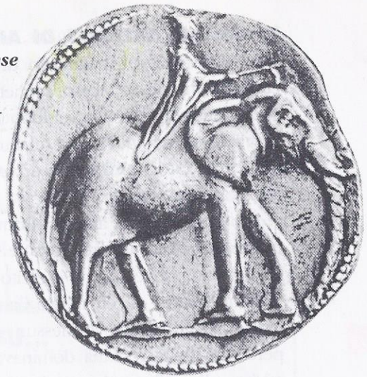
Moneta cartaginese del III secolo a.C.

Qui, un brillante generale cartaginese, Annibale , conquistò la città di Sagunto, alleata di Roma, creando così l'occasione per un nuovo scontro fra le due potenze: fu la seconda guerra punica .