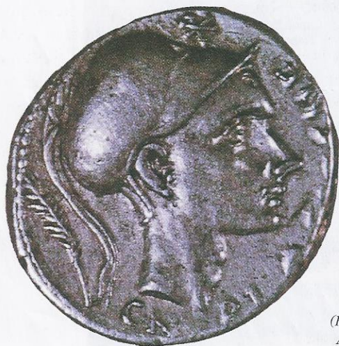
Moneta con l'immagine di Scipione Africano.

Non riuscì neppure il tentativo di Asdrubale , fratello di Annibale, di portargli soccorso via terra, scendendo con l'esercito dalle Alpi: Asdrubale fu sconfitto e ucciso dai Romani presso il fiume Metauro (207 a.C.).