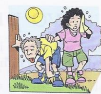
3. (noi) Adesso ..... sete.