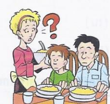
7. Ma non (voi) ..... fame stasera?