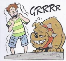
4. (io) ..... paura dei cani.