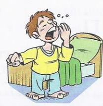
1. Luca ..... sonno.

1 Espressioni comuni con avere. Guarda le immagini e completa le frasi con le forme di avere .