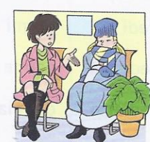
6. Signora, ..... freddo?