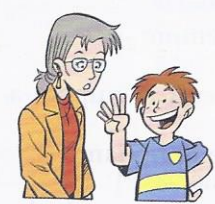
5. Quanti anni (tu) ..... ?