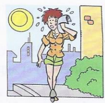
2. Flavia ..... caldo.